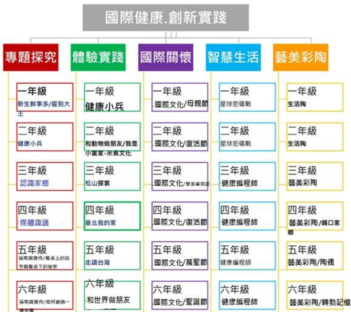
圖2-2 健康國小校訂課程年級主題圖

6.本校113學年度學校課程計畫審閱於獲局同意備查後公告校網供家長查閱。網址如下：