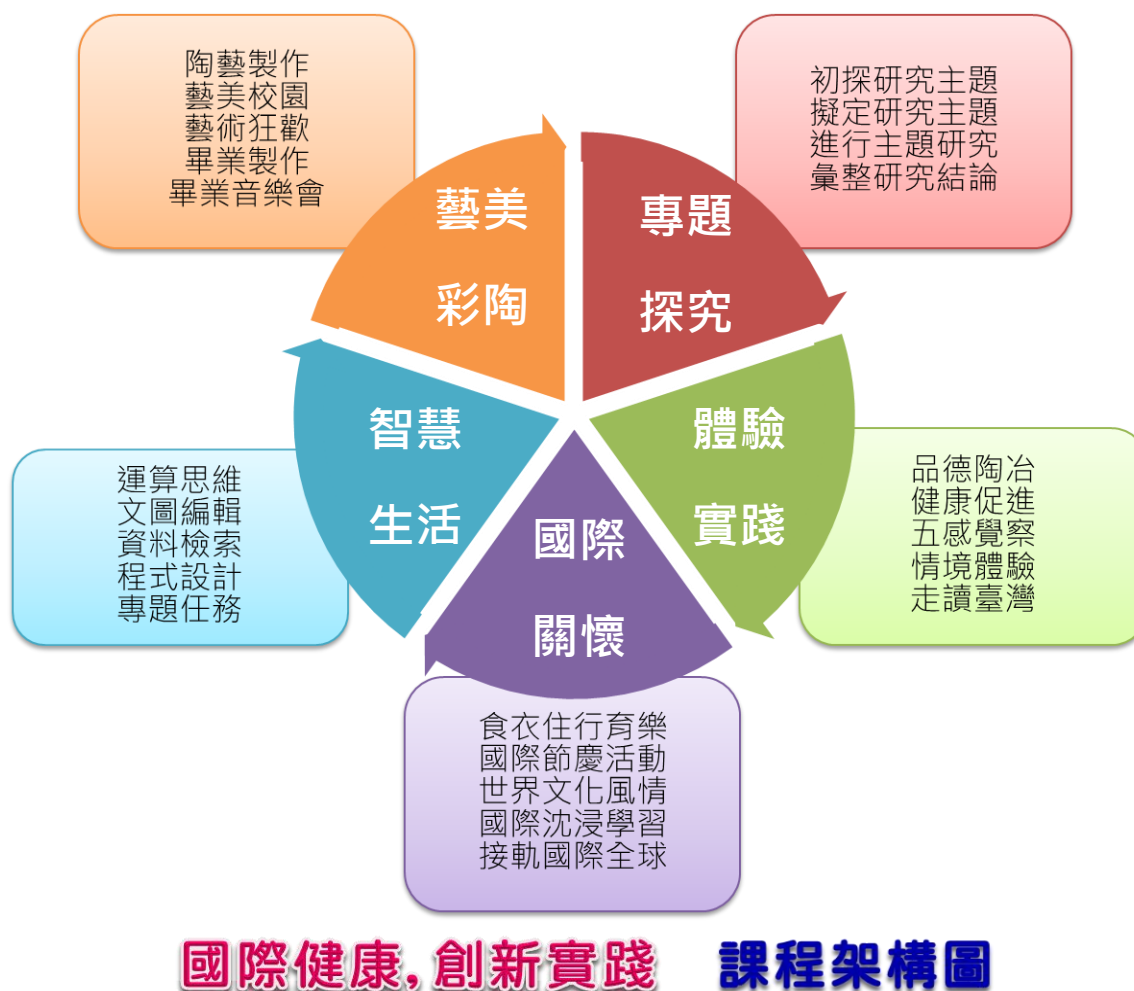
圖2-1 健康國小校訂課程架構圖