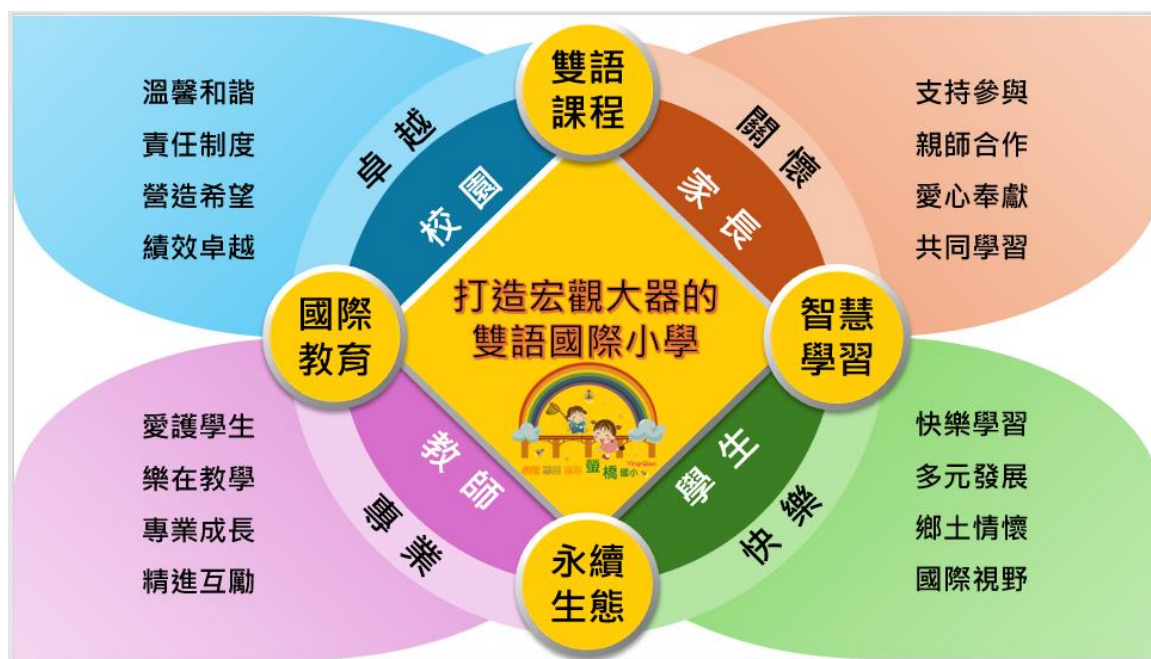
圖 2-1 螢橋國小學校願景