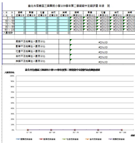
表 4-14 本校定期評量學生學習成效表 (導師、科任)