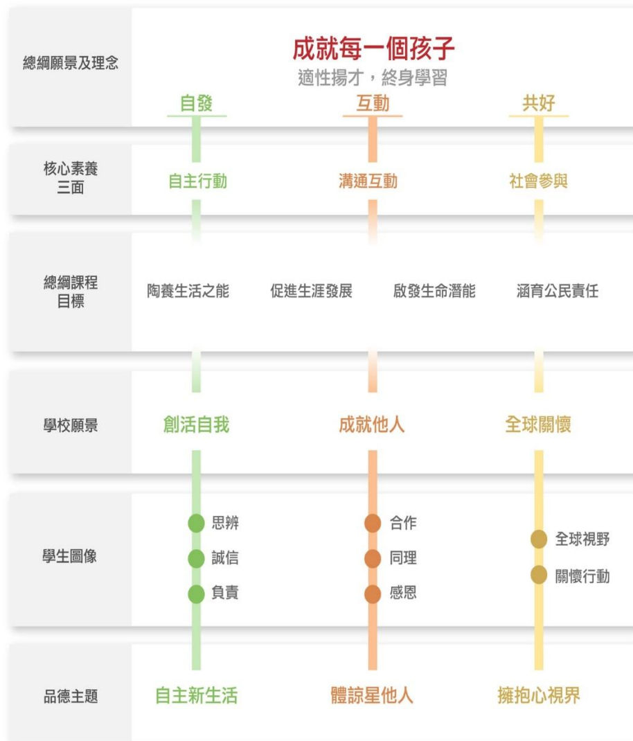
圖三：麗山國小學生圖像與學校願景關係圖