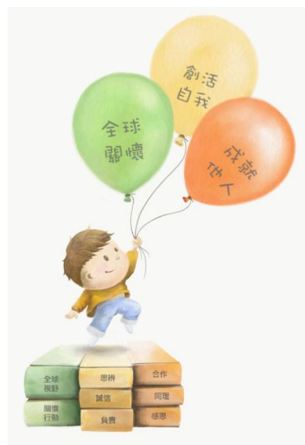
圖二麗山國小學生圖像