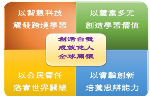
圖四：麗山國小課程願景與學校願景關係圖

墊基於課程願景，校內課程共備社群更在專家協助下，一起建構出「有品麗山 幸福悅讀」、「STEAM手創館」、「理財悠遊趣」、「寰宇麗麗 食在珍惜」等跨領域校訂課程架構，希冀能成就麗小學生未來成為獨立思考、積極負責、與人合作及具備世界胸懷的全球公民。