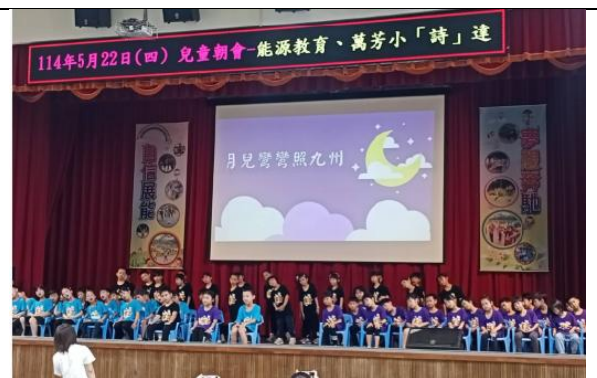
詩詞寶背-一年級朝會表演