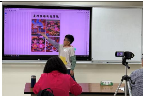
校內多語文競賽(臺灣台語演說)