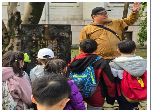
二二八公園校外教學