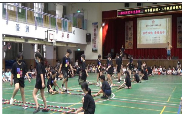
兒童朝會活動-竹竿舞