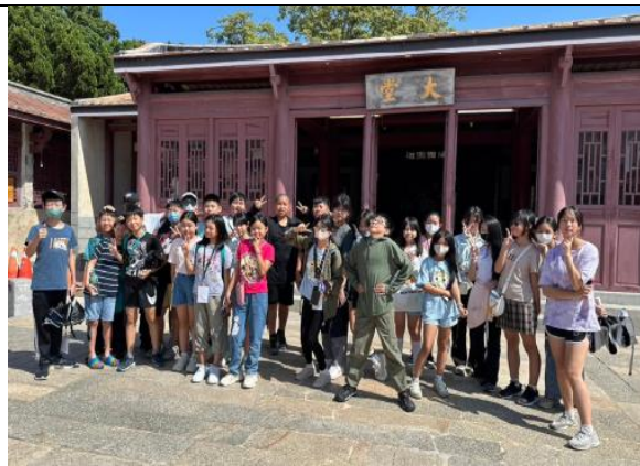
戶外教育-萬芳金沙國小 金門校際交流-老街踏查