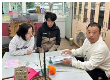
健體領域共備-學年競賽活動討論