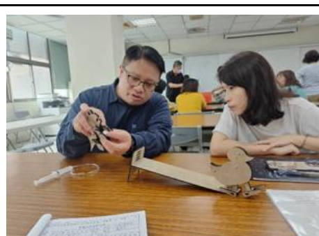
自然領域共備-STEAM 小鴨走路