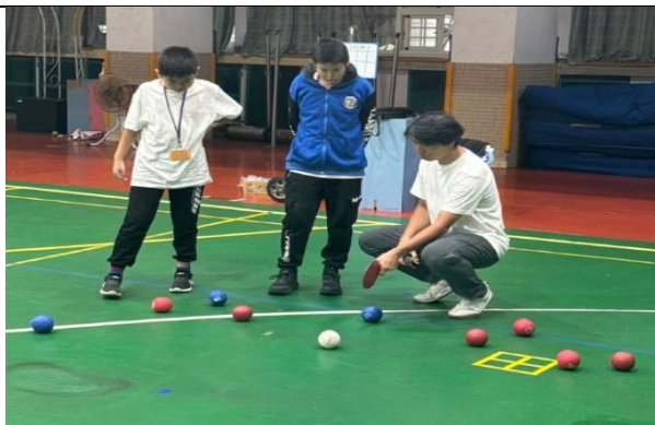
戶外教育-萬芳金沙國小 校際交流金沙國小回訪(地板滾球)