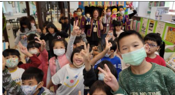
圖書館活動-小萬小芳劇場