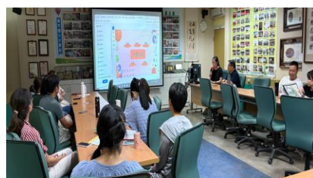
1140625 課發會-健體領域分享學年體育競賽