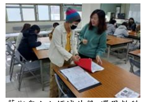
藝術與人文領域共備-選用教科書(音樂曲目)討論