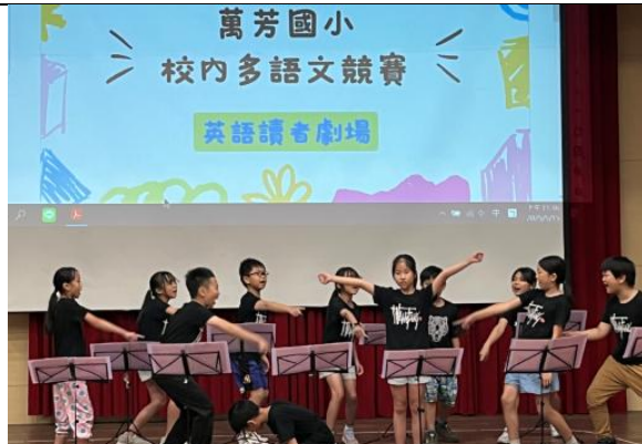
校內多語文競賽(英語讀者劇場)