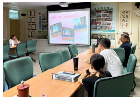
1140625 課發會-英語文領域分享課程-三年級英語歌唱