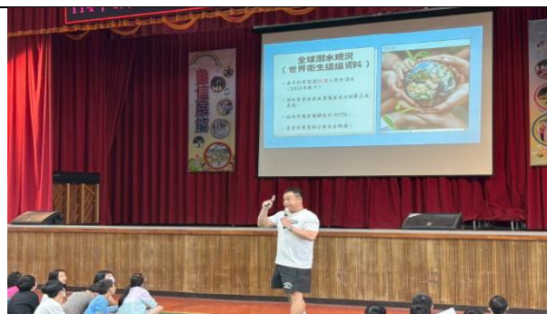
海洋教育-友善環境 (認識圖書館)