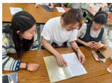
英語領域共備-學科縱向聯結研討