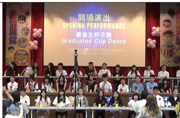
英語表演-畢業生杯子舞