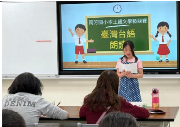
校內多語文競賽(臺灣台語朗讀)