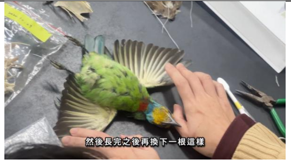
五色鳥標本製做課程影片 https://youtu.be/6-W9VP_2yPk