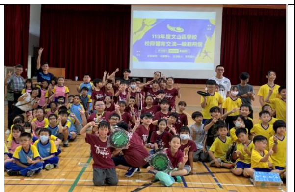
體育群組交流-飛盤比賽