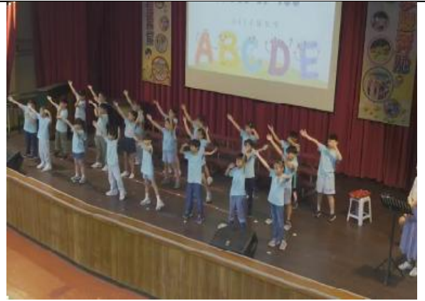
三年級英語歌唱朝會表演