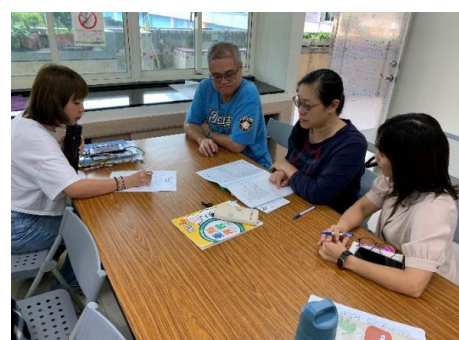
數學共備-幾何圖形教學