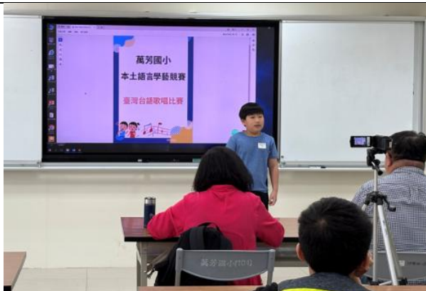
校內多語文競賽(臺灣台語歌唱)