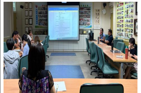
1140625 課發會-數學領域分享課程-領域會議與補救教學