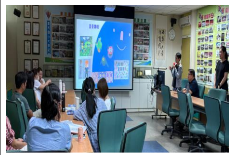
1140625 課發會-藝術領域分享雙語美勞