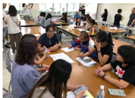
綜合領域共備-戶外教育分享