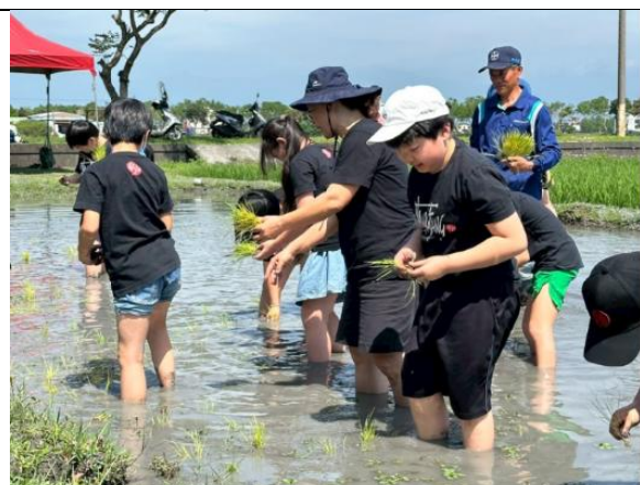
戶外教育-四年級宜蘭插秧活動