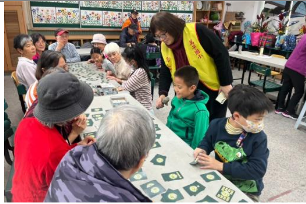
樂齡桌遊-代間課程