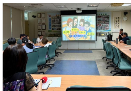
1140625 課發會-自然領域分享課程-STEAM 的嘗試-光影魔術師