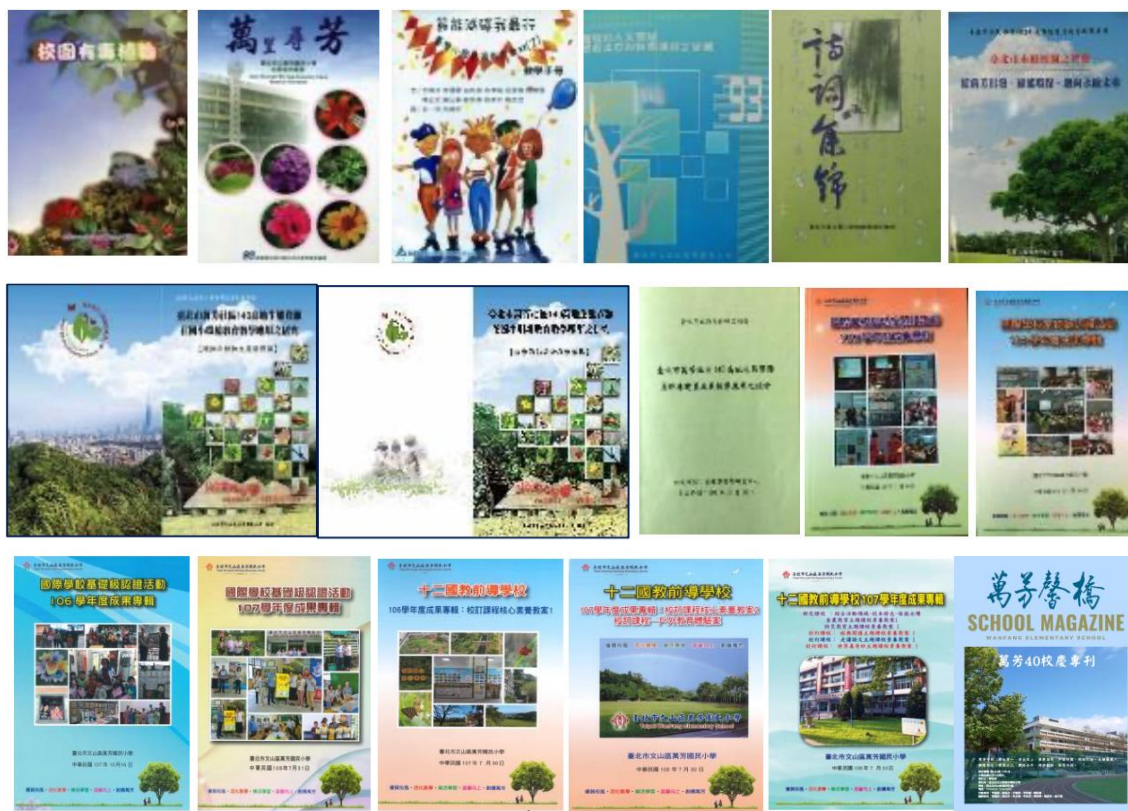
萬芳國小歷年學校特色暨教學研究出版品