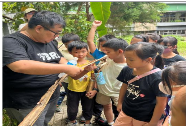
香蕉食農教育-觀察葉脈

校訂課程實施鼓勵採用多元評量方式，結合各項作品展、展演活動等，讓學生習得核心素養。