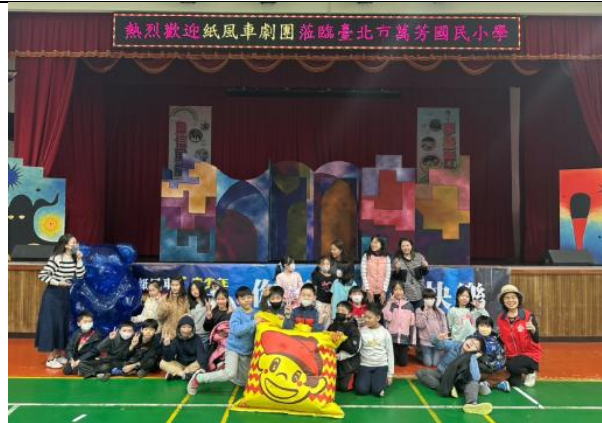
紙風車劇團反毒學習活動