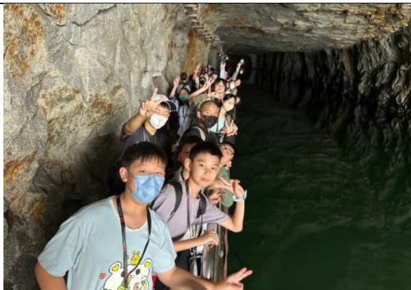
戶外教育-萬芳金沙國小 金門校際交流-(翟山坑道國防教育)