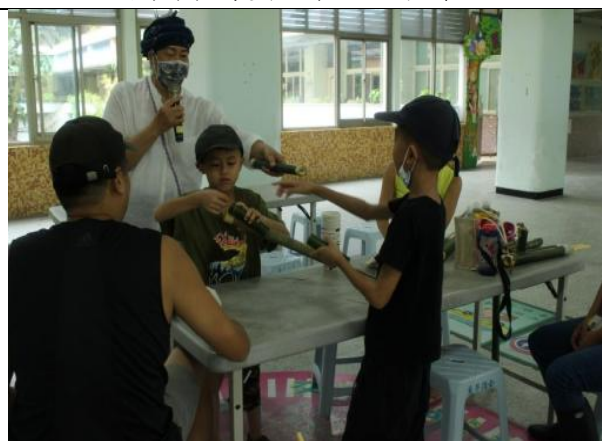
多元文化-阿美族原住民水槍