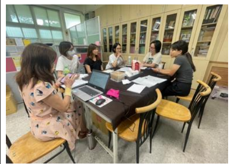
特教領域共備-公開授課討論