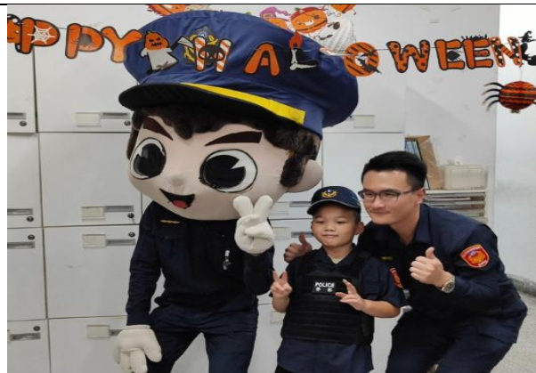
萬芳派出所-萬聖節小小警察