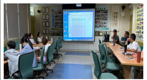
1140625 課發會-特教領域課程-PBL 與特教活動