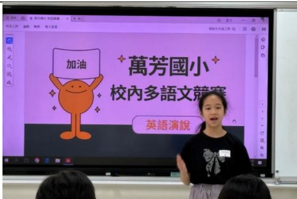
校內多語文競賽(英語演說)