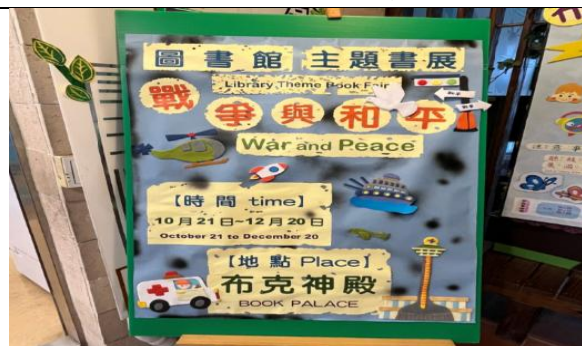
主題書展-戰爭與和平