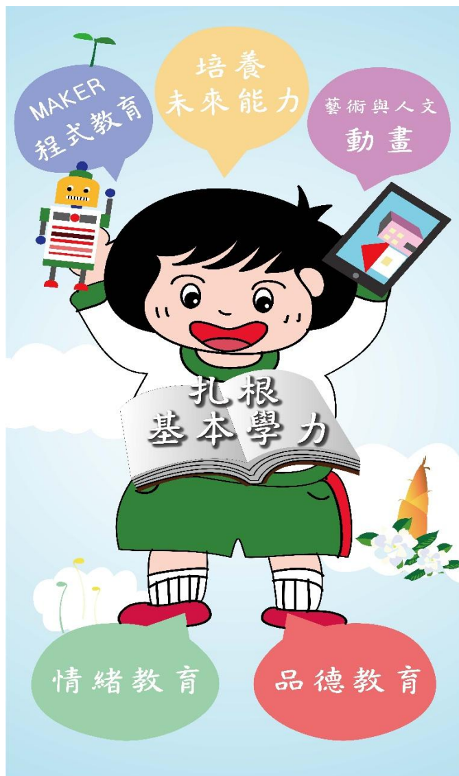
圖二-3 萬大好兒童圖象

緒教育的薰陶、扎根基本學力與能力、並培養與外界競爭的能力如:創客精神的程式教育和美感素養的動畫課程。至今歷經三年的經營，在教師、家長、學校的引導、啟發及關懷下，孩子儘管開始是一顆貌不驚人的種子，目前漸已形成一整個花季的燦爛！