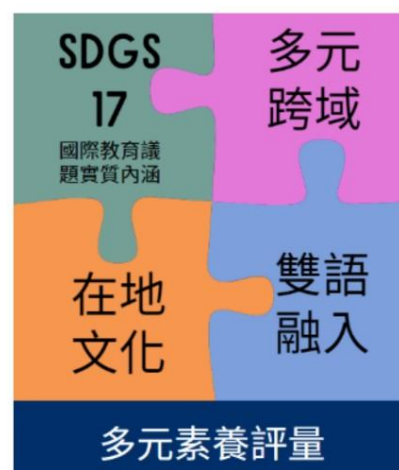
萬大國際課程-黃金四構面

「萬大雙語國際跨域主題課程」的規劃奠基於現有總體課程，以 SDGs 國際議題為核心，結合在地文化特色(Going global from local)，提取富萬大精神的跨領主題課程，課程設計首重「萬大黃金四構面」的融合元素，實踐從「本土瞭望國際、跨域鏈結統整、雙語成為工具」的目標。逐步所發展的課程方案主要以探究式行動方案為目標，培養萬大學子關心國際事務、思考國際問題、嘗試提出解決策略後展開解決行，成為擁有高度人道關懷的世界公民，擴展影響力彰顯國家價值。(課程發展歷程網頁：