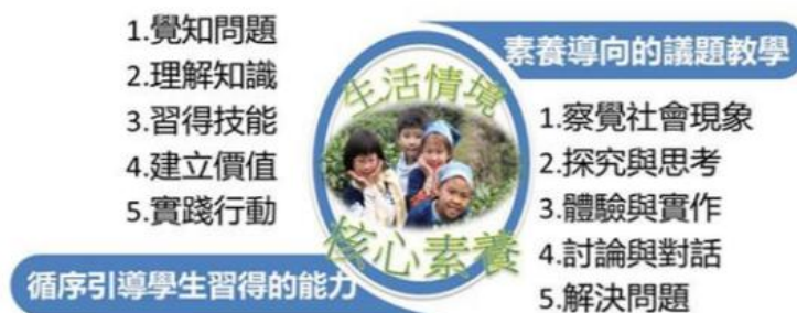
圖三-1 議題的教與學

本次十二年國民基本教育課程以「自發」、「互動」及「共好」為基本理念，「核心素養」為課程發展主軸，並強調議題融入課程。議題融入課程可從不同領域/科目角度對議題加以探究、分析與思考，提供跨領域整合的學習機會，彰顯問題的情境性與觀點的多元性。在進行時，宜循序引導學生覺知問題，掌握議題的知識理解，將各領域所習得的學科知能加以整合與應用，並培養學生對生活情境問題的分析與解決能力。另則藉由議題的可討論性，協助學生澄清價值，建立信念，且提供問題解決的學習與實踐機會，進而促使學生產生行動（請參見下圖）。由上所述，可知議題因其特性，將讓議題融入課程擴充原有領域/科目之學習，對於素養導向課程之落實，有加乘之效果。