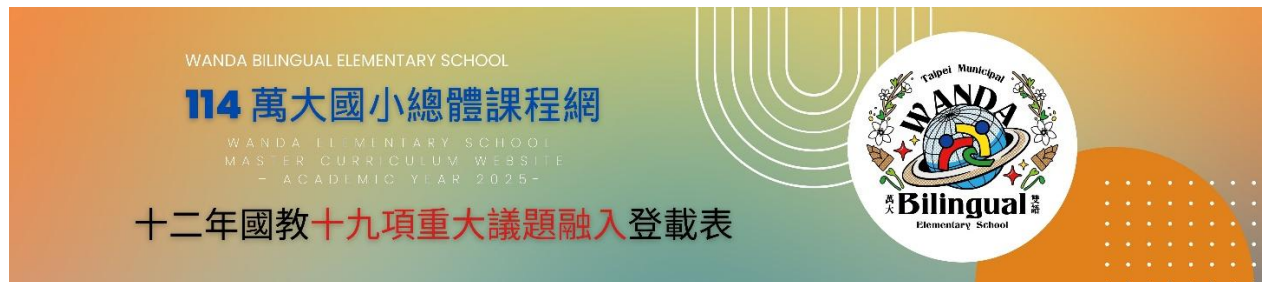
表三-3 法定重要教育議題工作融入課程規劃實施情形

本校在課程撰寫的同時採本統計分析表單來統計，旨在系統性蒐集與整理本校教師於議題課程的安排中，重視現行法律規定之性平教育法、特殊教育法、校園霸凌防制準則等強調之重要教育重點議題課程，提升整體教學品質和學生鏈結生活知識的能力與素養。表單統計結果顯示，多數教師能基本落實相關法規要求，但在「教材融入深度」及「課堂討論策略」方面仍可有深入發展的空間，未來將依據調查結果，強化相關主題研習、建立校本資源平台，並深化行政支持系統，以協助教師更有效地將法律規定與重要教育議題融入日常教學與校園文化之中。