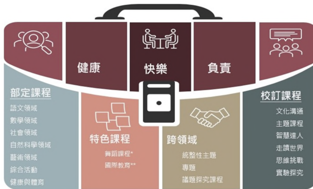
圖 1 臺北市中正區東門國小整體課程架構圖

臺北市東門國小以其深厚的舞蹈教育傳統和前瞻性的國際教育推動，發展出獨具特色的校本課程。