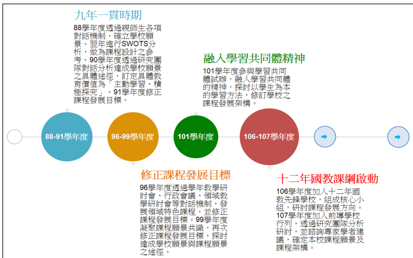
國語實小課程願景發展歷程