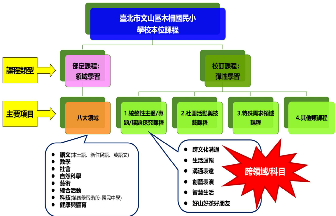
木柵國小總體課程架構圖

木柵團隊依循學校願景做課程發展，由「健康成長、關懷尊重」出發，研訂培育「健康關懷 智慧 創新的木柵小勇士」的課程願景，掌握「自發、互動、共好」核心素養，擬訂契合 108 課綱的課程目標，確立木柵四大課程主軸-「永保安康、擁抱家鄉、勇躍書海、詠歌之聲」，依據課程評鑑的結果，反思檢討並改進課程的實施。