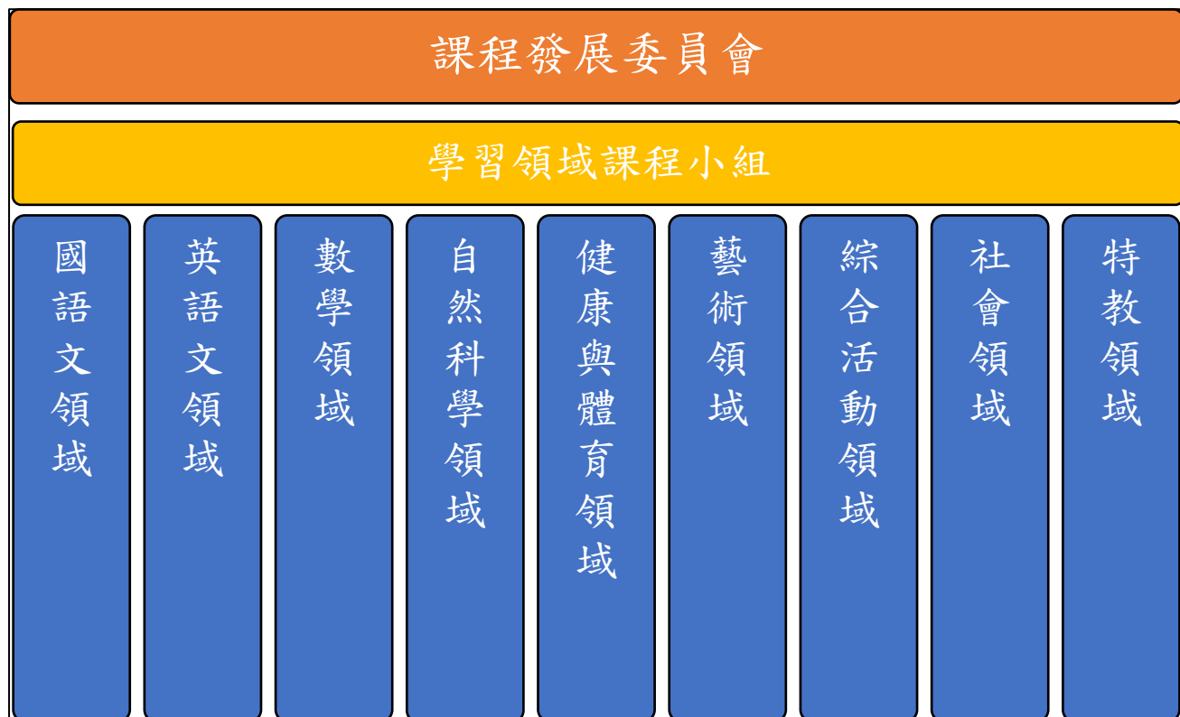
學校課程發展組織

本校課程發展組織設有課程發展委員會，課程發展委員會下分設九個學習領域課程小組。)，以下分別就課程發展委員會及學習領域課程小組之組織、職掌與分工說明之。