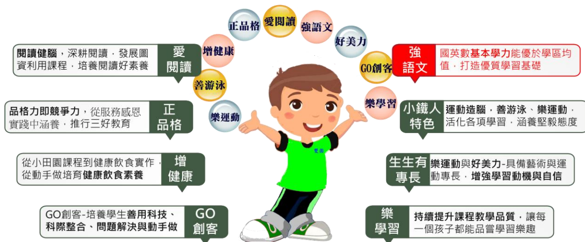
圖一 雙園兒童學生圖像

「帶領每一格孩子成功學習」是本校的課程願景，也是學校團隊對在地學子的教育品質承諾，多年來親師生攜手努力，奠基孩子們紮實的學習力，其表現在北市基本學力檢測、北市語文競賽以及北市分區運動會、健身操、游泳、武術、角力等各項運動賽事，均有卓越表現。