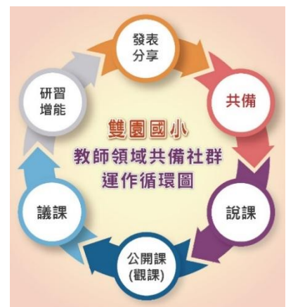
雙園國小 114 學年度雙語教師共備社群增能期程表

透過完善的增能、共備、夥伴聯盟等支持系統激發現職教師的雙語教學潛能與信念，提升其雙語教學的自我效能感，使其雙語教學知能不斷發展並獲得肯定，是支持本校雙語教學現階段發展的重要力量。本校以「行政團隊+領域共備社群+雙語教學教師專業學習社群」團隊合作模式，召集雙語教師與英語教師共組教師專業學習社群，外部參加雙語學校聯盟，並連結建置雙語教學資源網與諮詢平臺、連結雙語教學評量資源、連結臺北市雙語輔導團、善用相關知識共享平臺，同時整合雙語教學資源(含軟硬體)，規劃行政團隊的雙語增能，展現注意力經濟效應，全面帶動全校性的雙語教學實踐。