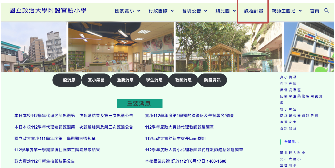
圖 4.1 本校課程計畫上傳網站圖