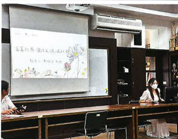
說明:113 學年度國語文領域評鑑與分享