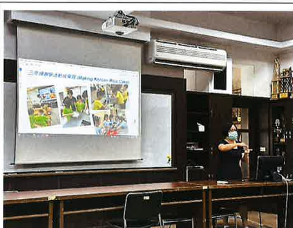
說明:113 學年度英語文領域評鑑與分享