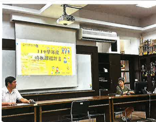
說明:114 學年度特殊教育課程逐一報告和特生課程規劃詳細說明