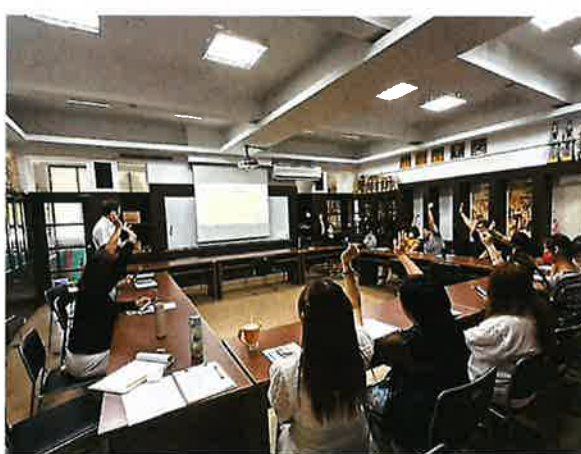
說明:舉手表決共 16 票通過 114 學年度所有課程計畫、行事曆和雙語課程規劃

捌、最後附上 114.07.02-113 學年度第 3 次期末課程發展委員會簽到表。