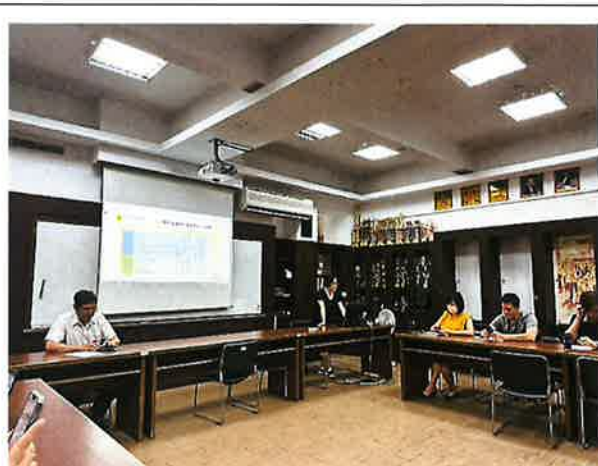
說明:114 學年度整體和部定課程逐一報告