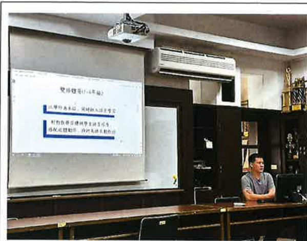
說明:113 學年度健體領域評鑑與分享