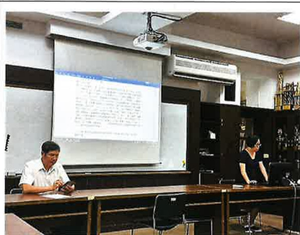
說明:114 學年度校訂課程審閱通過報告