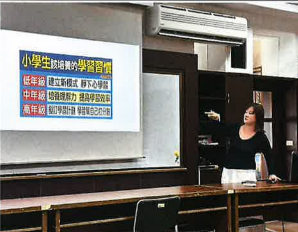
說明:113 學年度數學領域評鑑與分享