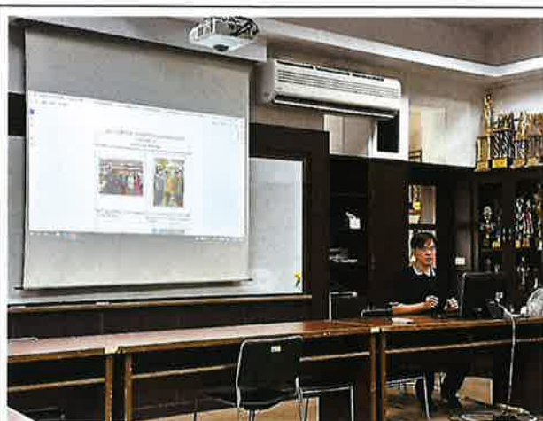
說明:113 學年度藝術領域評鑑與分享