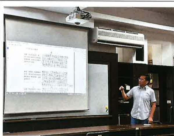
說明:113 學年度社會領域評鑑與分享