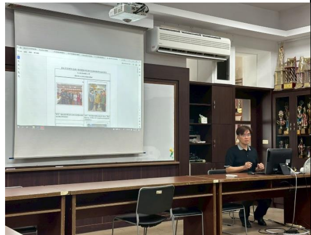
圖 10:113 學年度藝術領域評鑑與分享