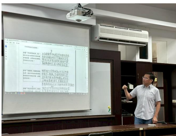
圖 11:113 學年度社會領域評鑑與分享