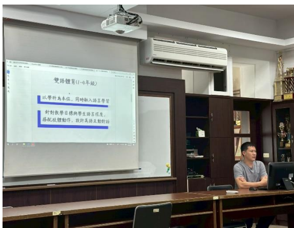
圖 9:113 學年度健體領域評鑑與分享