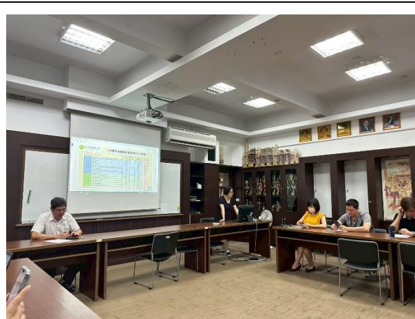
圖 4:114 學年度整體和部定課程逐一報告