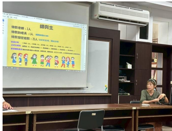
圖 5-6:114 學年度特殊教育課程逐一報告和特生課程規劃詳細說明