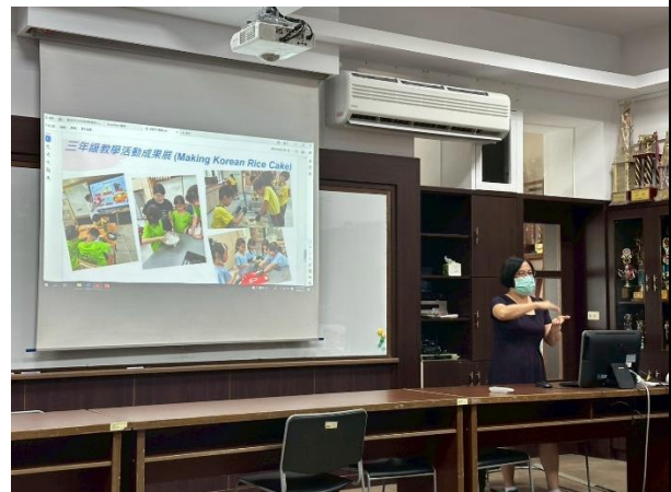
圖 12:113 學年度英語文領域評鑑與分享