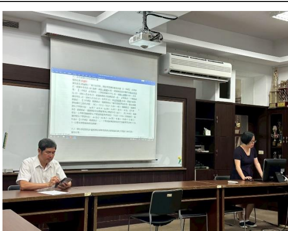
圖 3:114 學年度校訂課程審閱通過報告