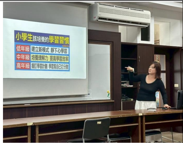
圖 8:113 學年度數學領域評鑑與分享