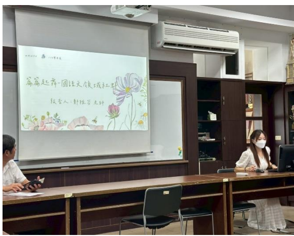
圖 7:113 學年度國語文領域評鑑與分享