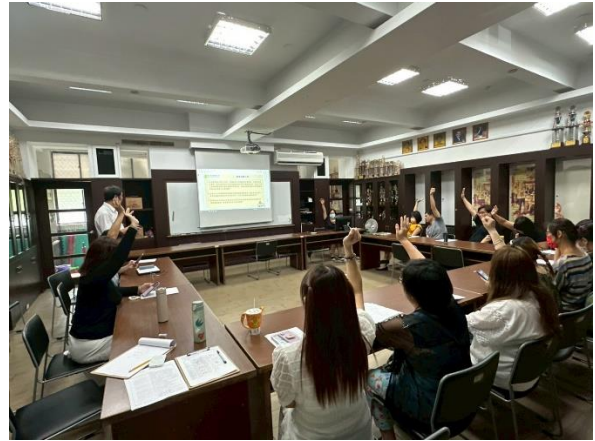
圖 14:舉手表決共 16 票通過 114 學年度所有課程計畫、行事曆和雙語課程規劃