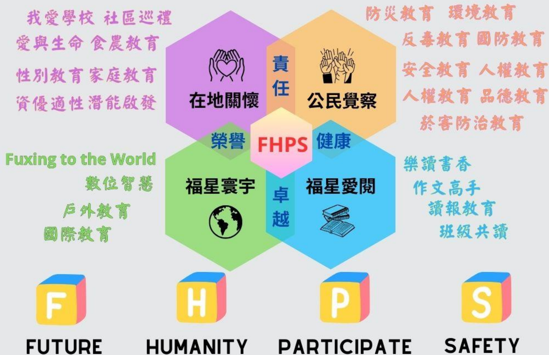
福星國小校本課程及彈性課程結構圖