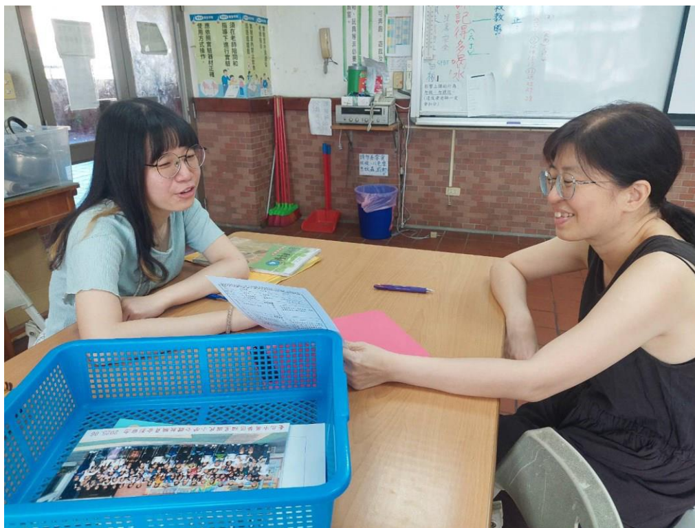
活動：說課/共同備課