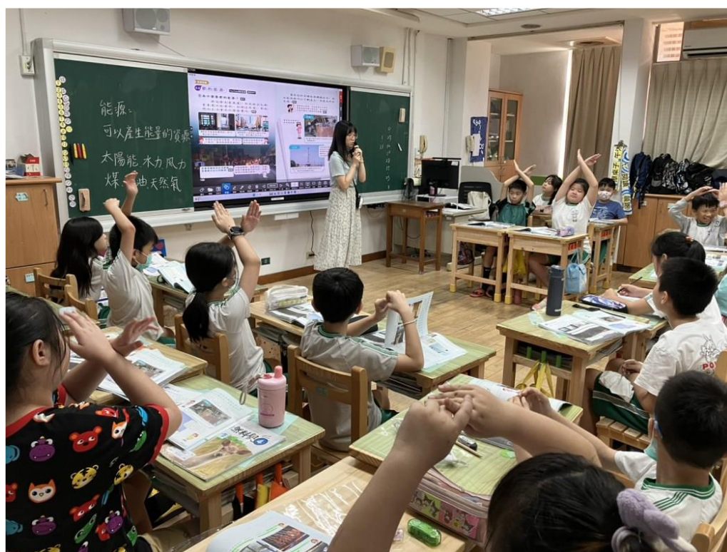
活動： 公開授課 /課程評鑑