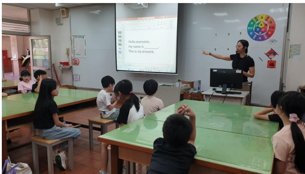
活動： 公開授課 /課程評鑑