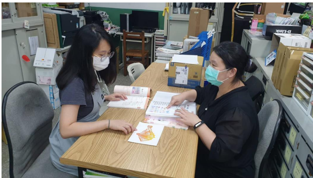
活動：觀課前說課會議