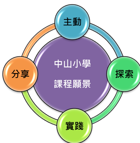
圖 2-1 私立中山小學課程願景