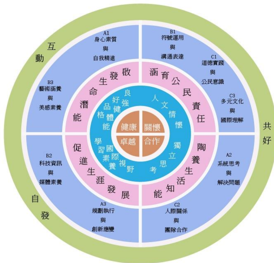
圖 2：12 年國民基本教育志清國小課程願景圖