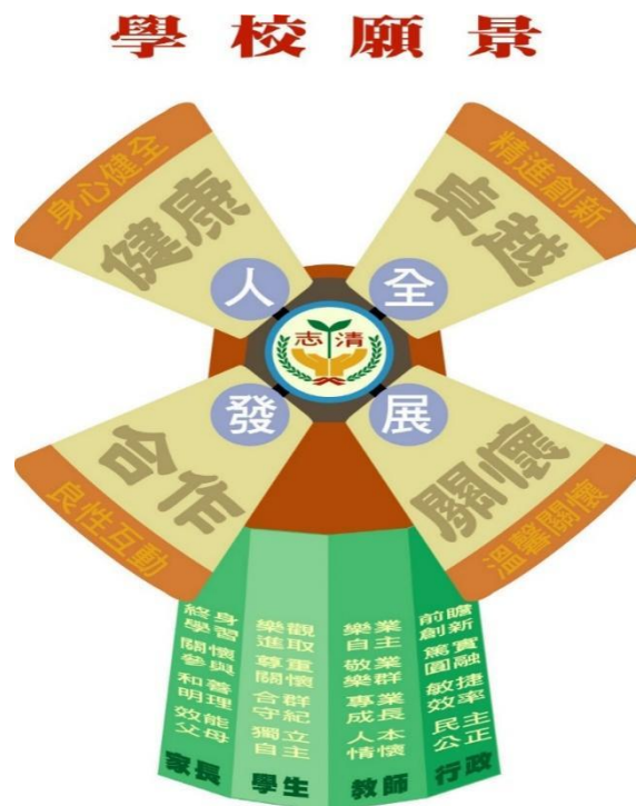
圖 1 志清國小學校願景圖

在景美溪畔，有著一座轉動的風車，她有著溫潤的外在、敦厚的內涵、堅毅的腳步、踏實的節奏。轉動的風車，引來一股生生不息的動力，吹拂著孩子的心、浸潤著師生的情。她深深的知道，只要風葉不停，就能吹著和暖的風，陪伴孩子前行。