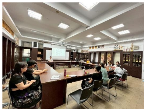
圖 7：萬福國小 113 學年度第 2 學期期初、期末特推會議