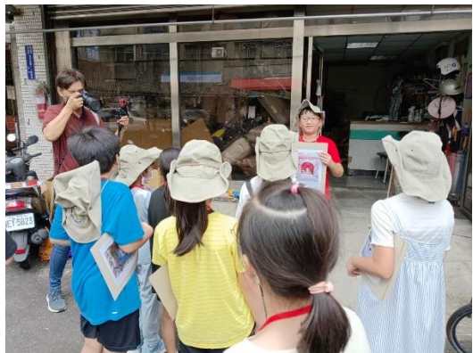
圖 12-13:假日辦理親子社區小旅行-小小解員導覽培訓活動