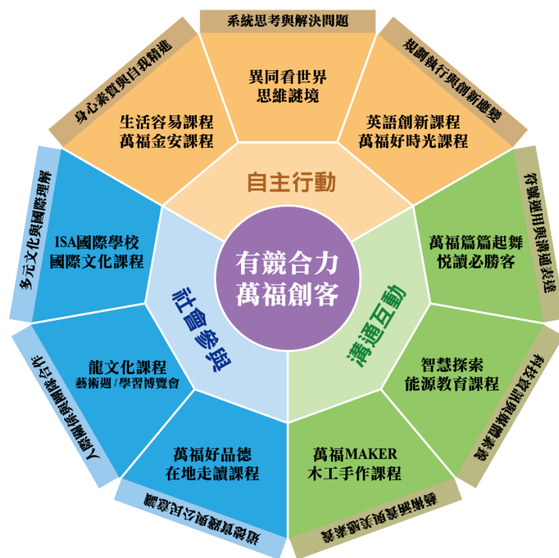
圖 3：萬福國小課程與活動對應十二年國教圖像

萬福國小願景的落實，除盤整過往深耕發展的課程內容外，對應十二年國教課程課綱「自發、互動、共好」的核心理念，延伸為自主行動、溝通互動、社會參與等三面項，與九項核心素養：身心素質與自我精進、系統思考與解決問題、規劃執行與創新應變、符號運用與溝通表達、科技資訊與媒體素養、藝術涵養與美感素養、道德實踐與公民意識、人際關係與團隊合作、多元文化與國際理解。學校十二年國教課程規劃小組，綜整領域社群小組與學年學群小組的課程發展規劃，建構學校課程與活動對應十二年國教圖像，藉以凝聚學校課程與活動向心力，並能逐步落實學校願景。