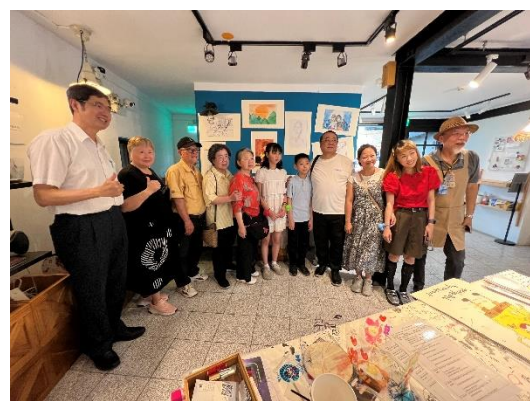
圖 11:教輔為特教生寶藏巖辦理個人畫展