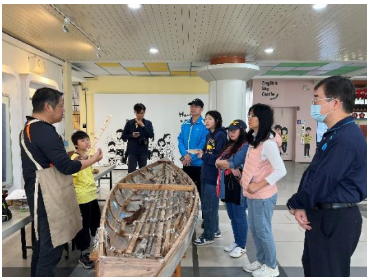
圖 8:教師木工課程-假日造舟增能研習

生寫春聯雙語創作活動、駐校藝術家、深耕藝術之表演或視覺藝術、樂齡學堂藝術創作班……等實作課程。