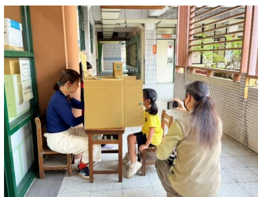
圖 17: 駐校藝術家-我不是機器創作