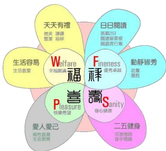
圖 1：91-104 年萬福國小願景圖

萬福國小自九年一貫課程實施起，學校願景為「福祿壽喜」，透過幸福圓滿、優秀卓越、快樂希望、身心健康等四個主軸與六套課程，來落實與建構學生學習圖像。然而，隨著時代的進展與新一代的課程革新，「我們應該要給萬福的孩子什麼樣的能力？」這是學校的經營願景，也是孩子們的未來願景。我們希望給孩子一個有能力做夢的梦想者，所以他必須是 MAKER 創客，願意面對挑戰，願意實踐夢想。因此，行政及親師團隊透過多重對話與討論，共同發想與建構萬福新願景「有競合力的萬福創客」，以有品生活、扎根文化與國際視野三大主軸來實踐願景，而後由課程發展委員會討論與詮釋，並於校務會議確認通過。