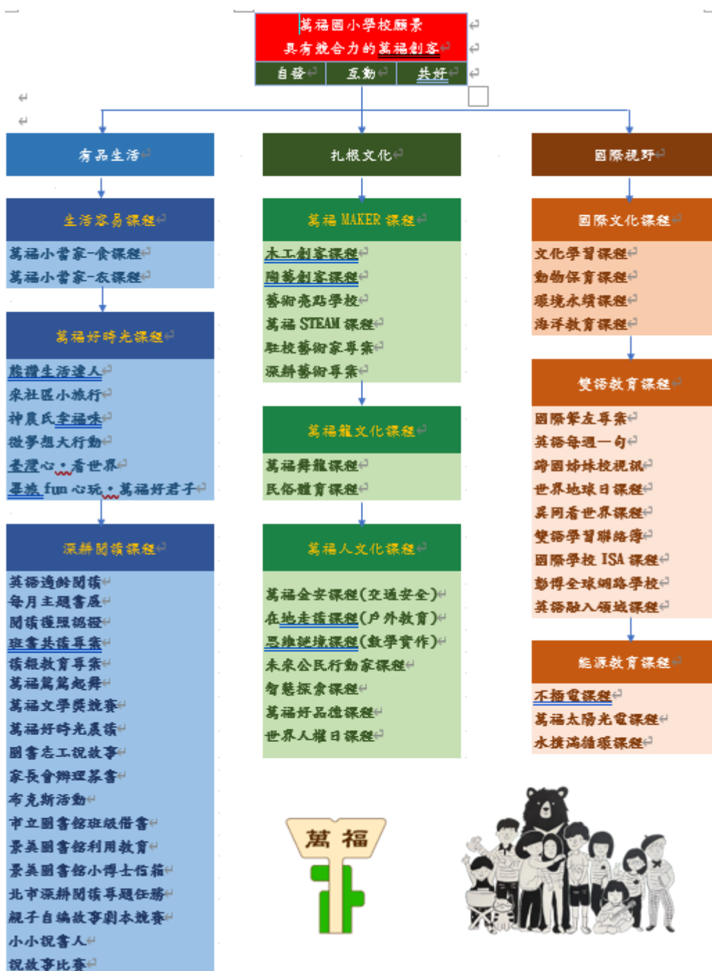
圖 5：學校願景與課程發展架構圖

萬福校本課程以培養萬福創客為核心，深化原已建構之生活容易課程、深耕閱讀課程、萬福 MAKER 課程、萬福龍文化課程、能源教育課程，並加上近年來持續推動的國際教育課程、雙語教育課程、萬福好時光課程，培養自發、互動共好的萬福學童。