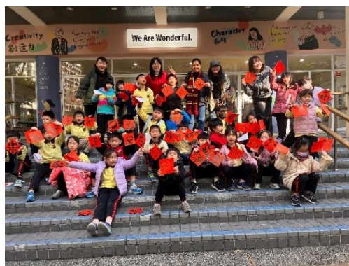
圖 14-15: 因應春節節慶活動~辦理全校親師生寫春聯雙語創作教學活動