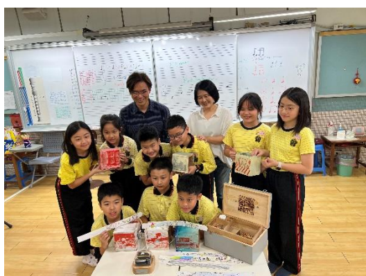
圖 16: 家族故事音樂創作