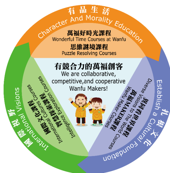
圖 2：105 年～迄今 萬福國小願景圖