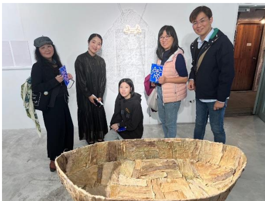
圖 10:寶藏巖藝術家發表活動