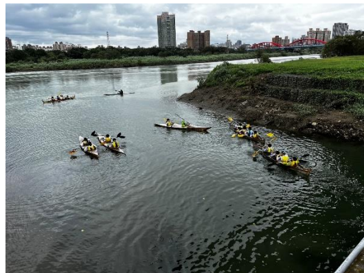
圖 9:畢業系列-萬盛溪划舟體驗課程