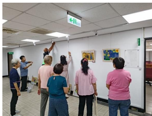
圖 18-19: 駐校藝術家-樂齡長者/獨木舟水墨畫介紹-古亭地政畫展展出