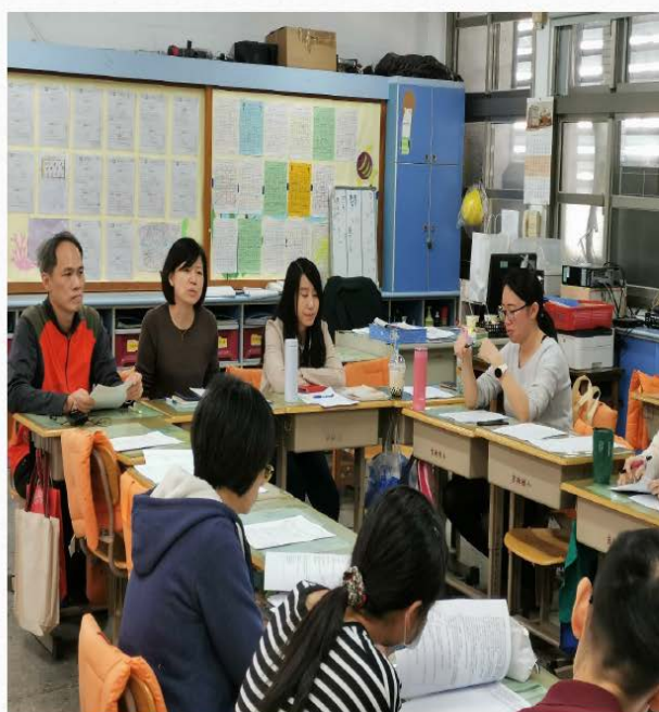
校訂小組與執行學年討論各主軸與課程內容簡介