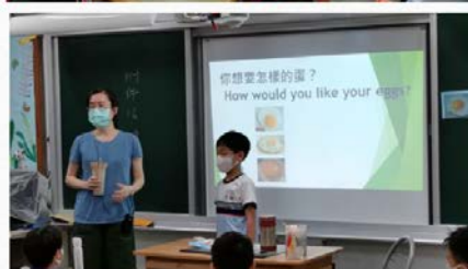
吉食行樂-出國如何點餐(以蛋的料理為例)