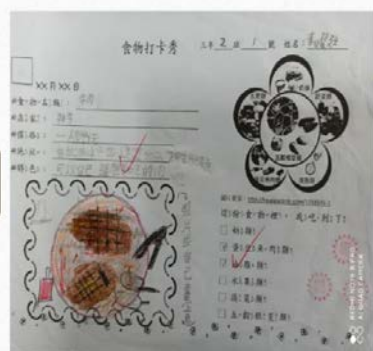
吉食行樂-食物打卡秀