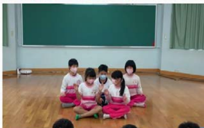
吉藝傳揚--- 二年級肢體律動