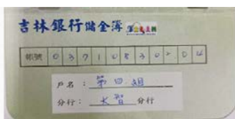
存摺遊戲封面與內頁