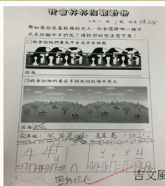
吉文風雅-二年級畫圖說故事