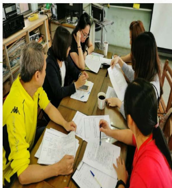
校訂小組課程研發討論會議