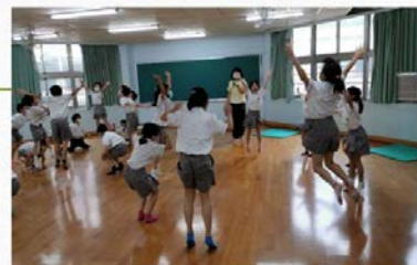
吉藝傳揚—— 用身體說故事