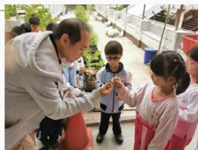
吉食行樂-吉林小田園