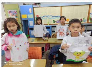
吉藝傳揚--- 狐假虎威戲劇演出