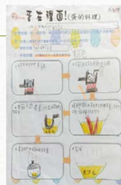
吉食行樂-蛋的料理