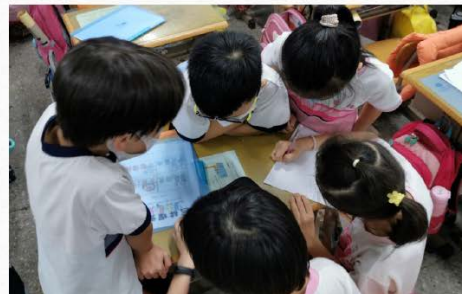
古文風雅—— 故事分析師