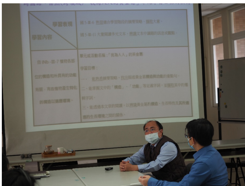
【增能講座】 素養導向教學設計與評量---楊俊鴻教授。