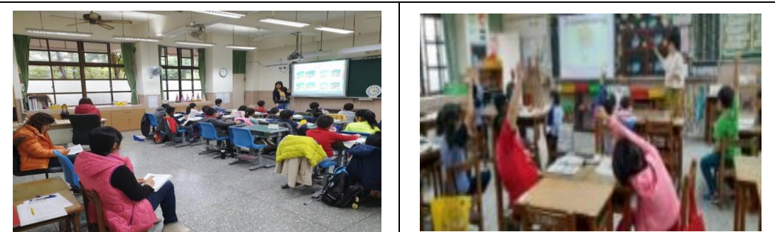
教師公開授課/校長親臨觀課