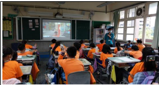
學生收看讀報小達人首播。