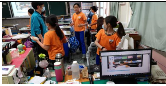
學生給予讀報小達人回饋打賞肯定。