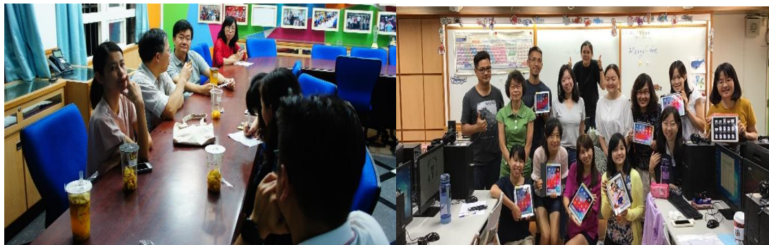
邀請越語、泰語老師與學校老師共同進行：課程發展對談、行動學習增能