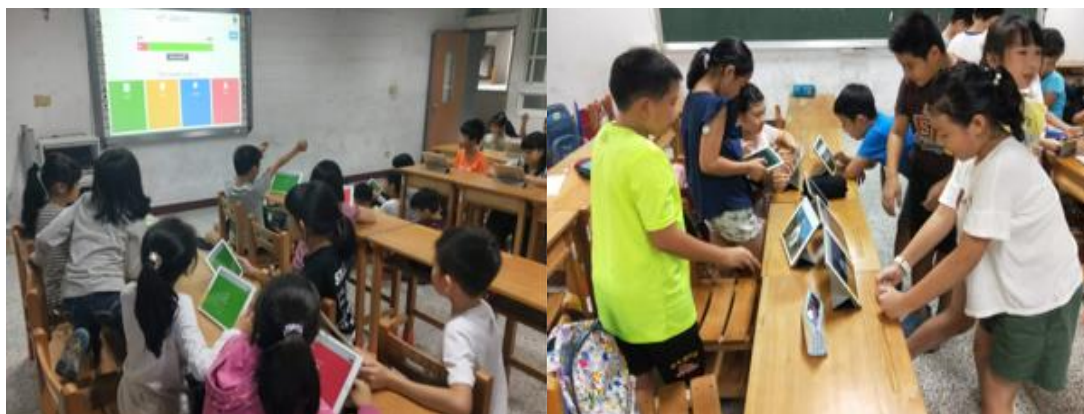
越語、泰語教學嘗試加入平版、行動學習