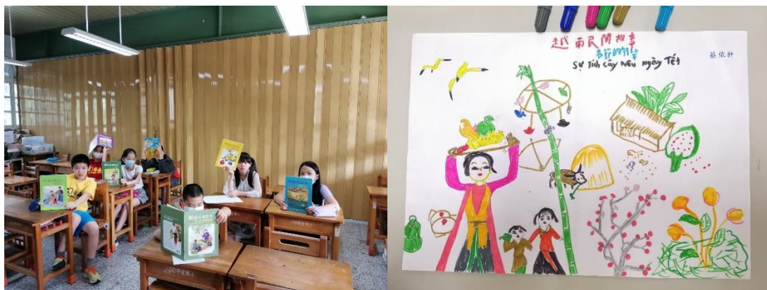
享閱國際-越南民間故事繪本