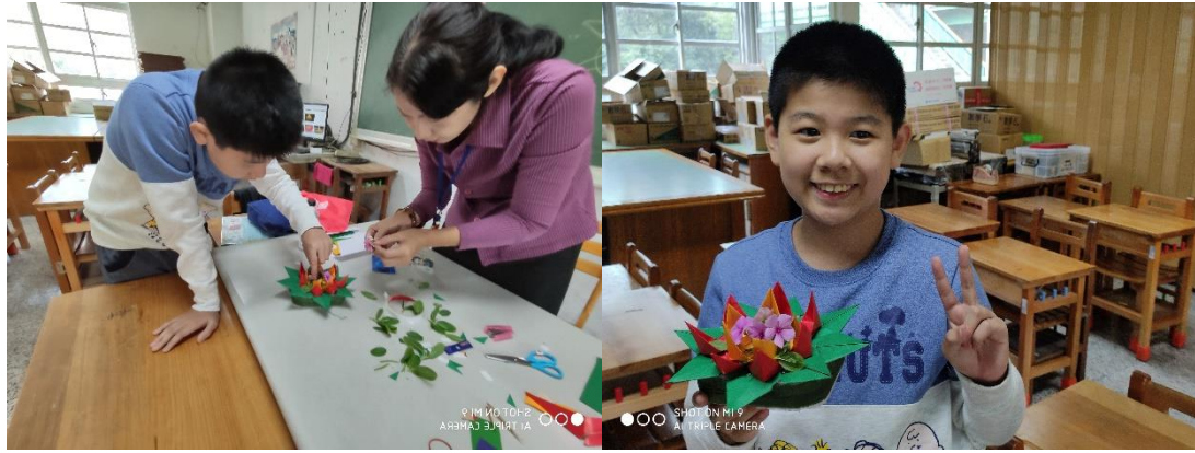
國際文化體驗－泰國花燈製作