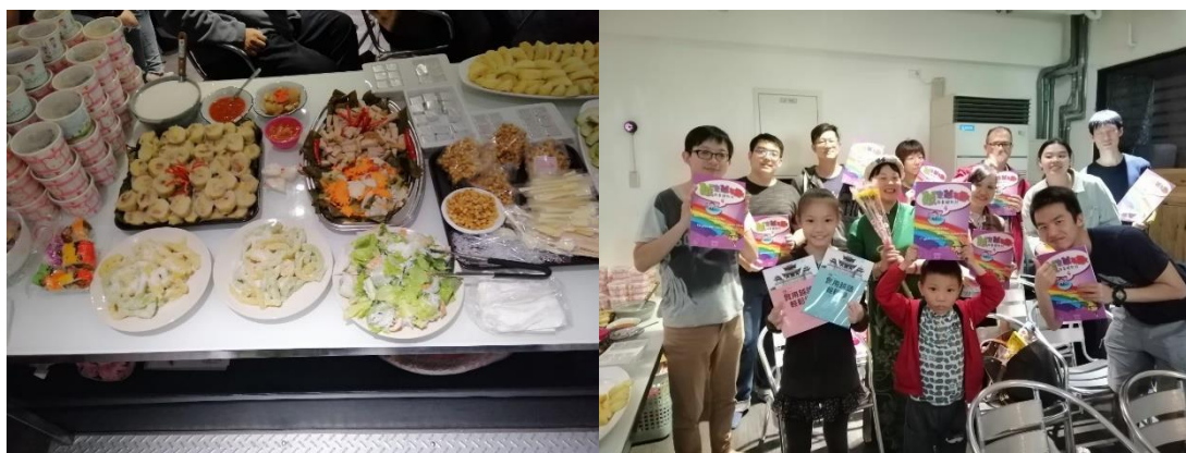
饗耀世界-國際美食展親子同樂