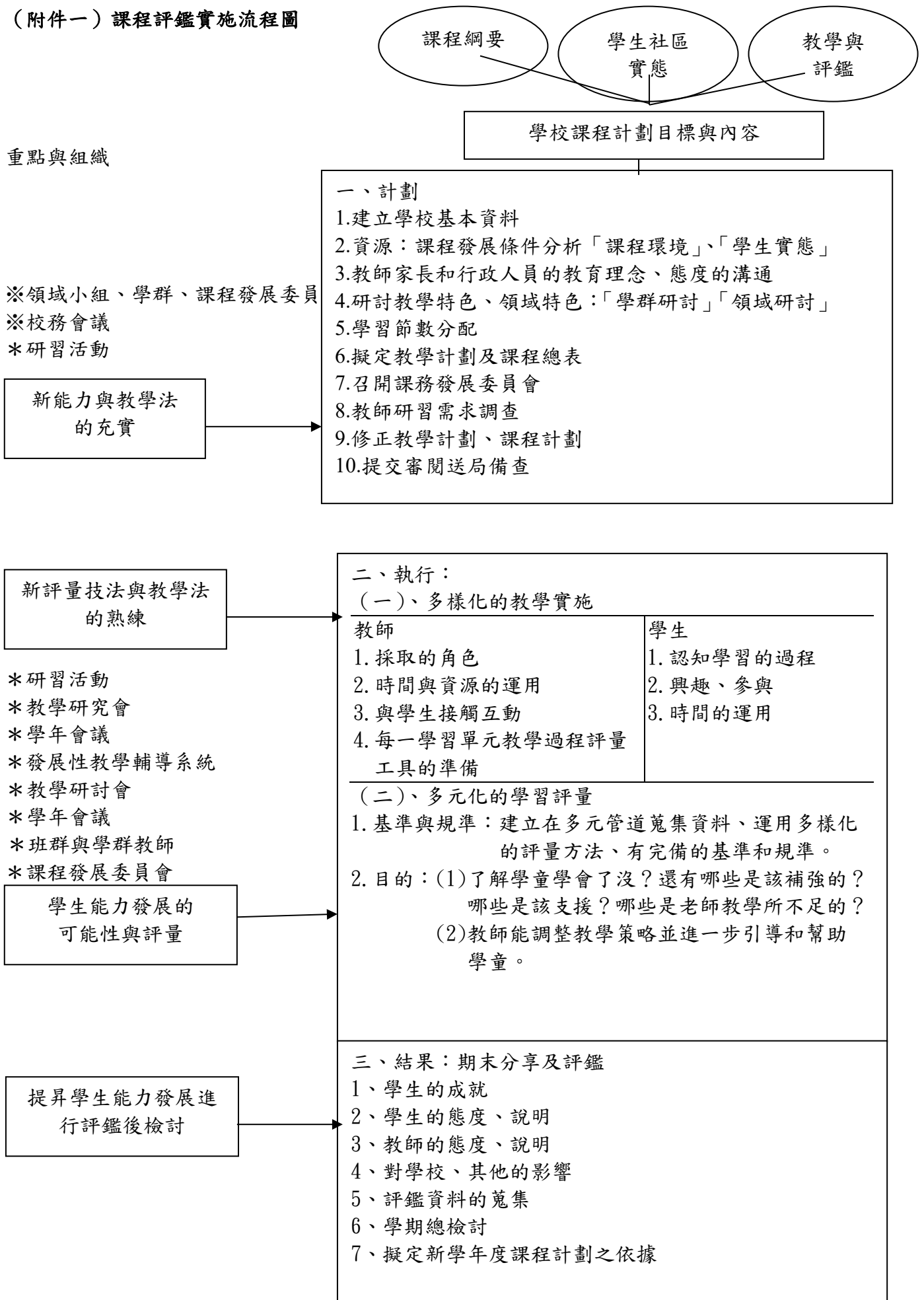
(附件一) 課程評鑑實施流程圖