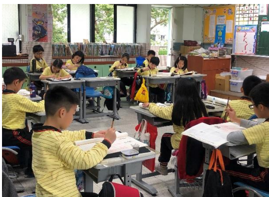
圖 2：中年級學生在班級教室寫書法