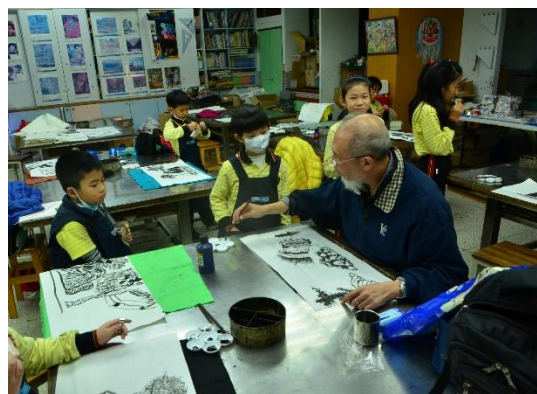
圖 3：高年級學生在木工教室寫書法