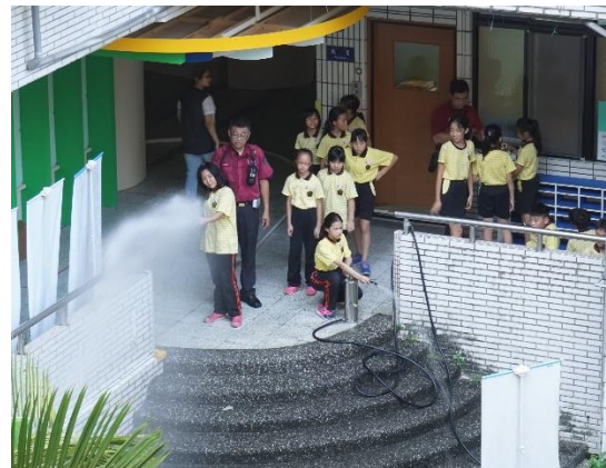
圖 22：五年級學生消防體驗活動