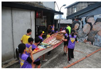
圖 19：學生搬運參展作品