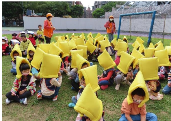
圖 21：學生參與防災演練