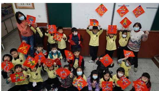
圖 4：低年級學生斯貼春聯