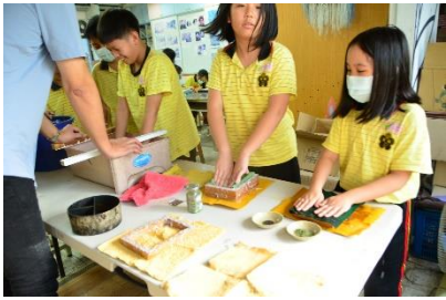
圖 17：環保手抄紙製作