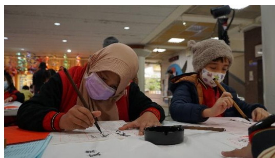
圖 5：外籍學生體驗寫春聯