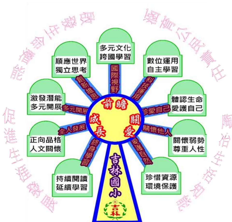
學校課程願景圖像