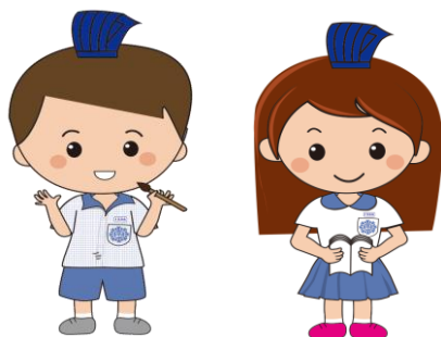
左圖 日新好兒童-悅讀小雅仕圖像 日新校訂課程--日新閱藝課的「日新好兒童」圖像，即是以培養學生成為書法與閱讀的小雅仕為目標。