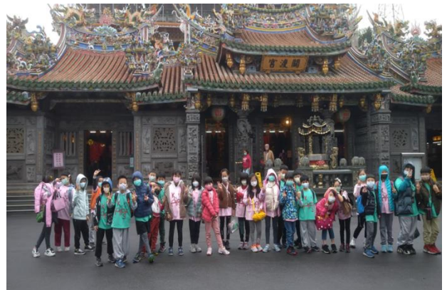
三年級/ 關渡宮巡禮