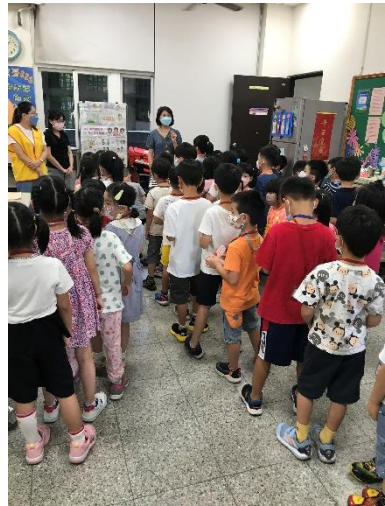
一年級/ 認識校園參觀活動