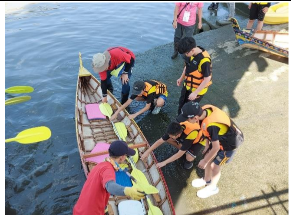
六年級/學生準備上岸