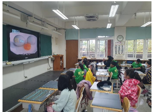
四年級/ 照片說明：蛋知識