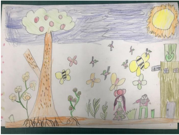
一年級/ 校園活動創作