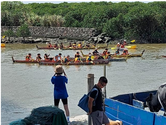
六年級/學生划舟中