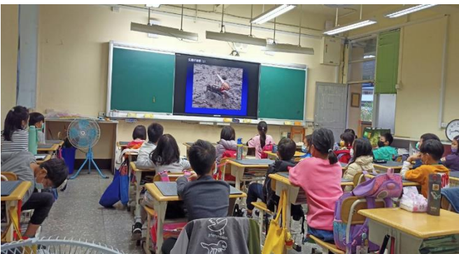
三年級/ 四寶之一招潮蟹(影片欣賞)