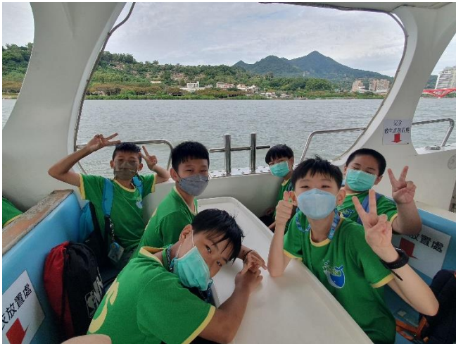
四年級/ 照片說明：潮汐旅遊：藍色水路