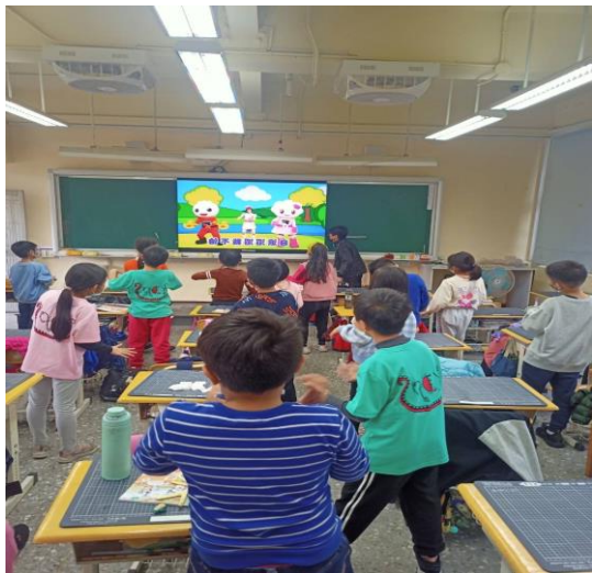
三年級/海洋樂曲演唱