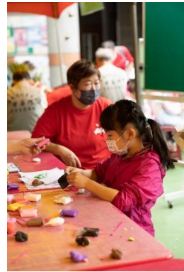
二年級/ 米糰雕體驗