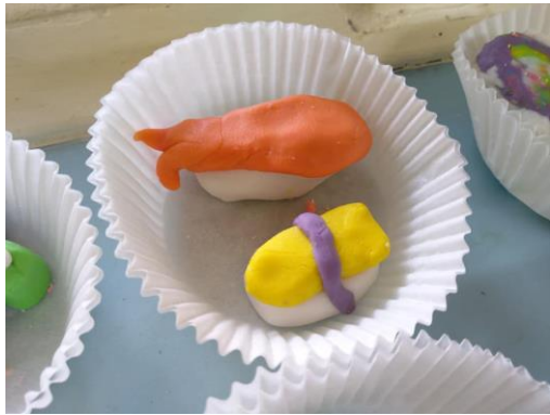
二年級/ 米糰雕作品