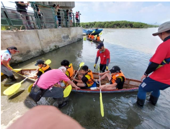
六年級/學生準備出航