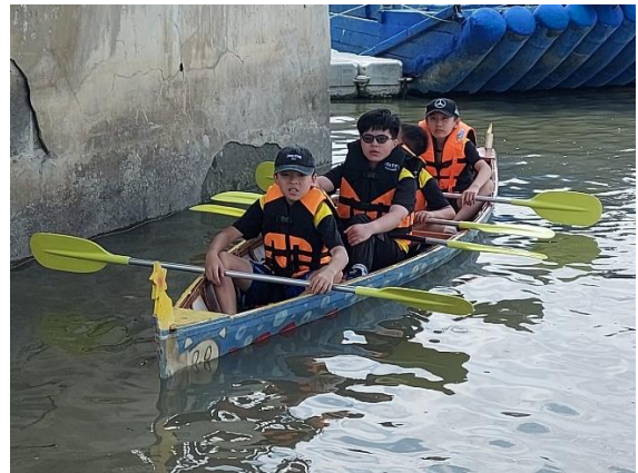
六年級/學生準備出航