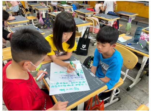
三年級/分組童詩創作(濕地選美大賽)