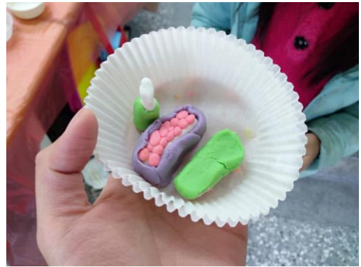
二年級/ 米糰雕作品