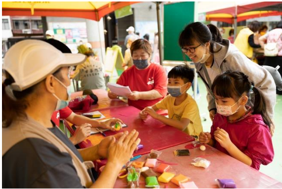
二年級/ 米糰雕體驗