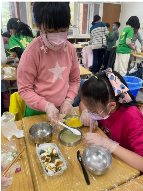
四年級/ 照片說明：蛋料理體驗—三色蛋