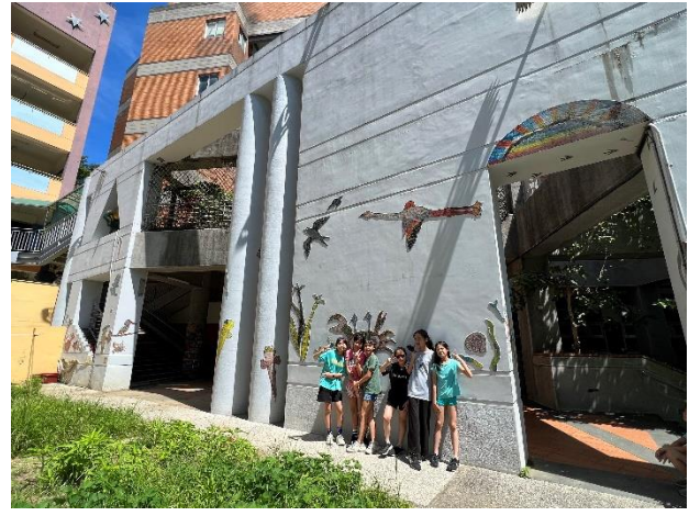
五年級/ 學生與公共藝術合影