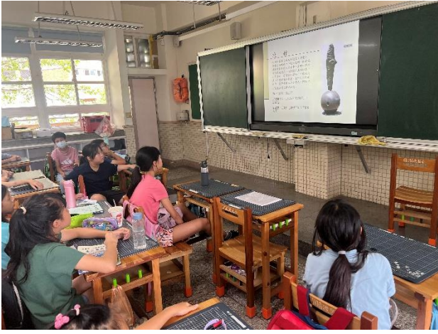
五年級/學生認識學校公共藝術