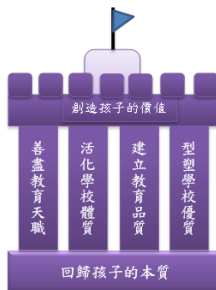
臺北市玉成國民小學教育目標圖