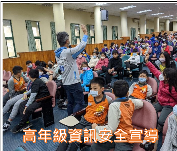
高年級資訊安全宣導