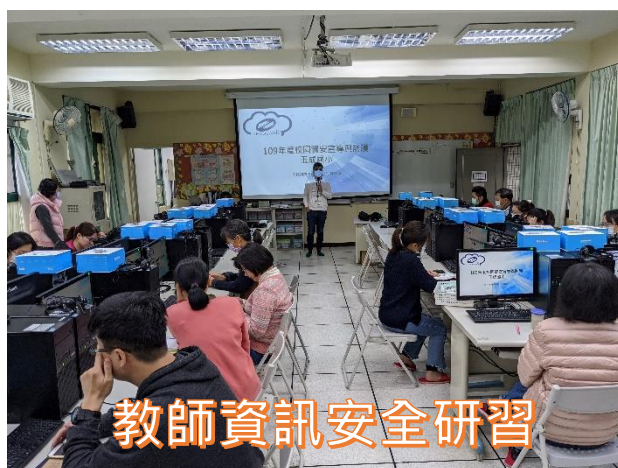
教師資訊安全研習