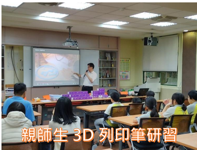
親師生 3D 列印筆研習