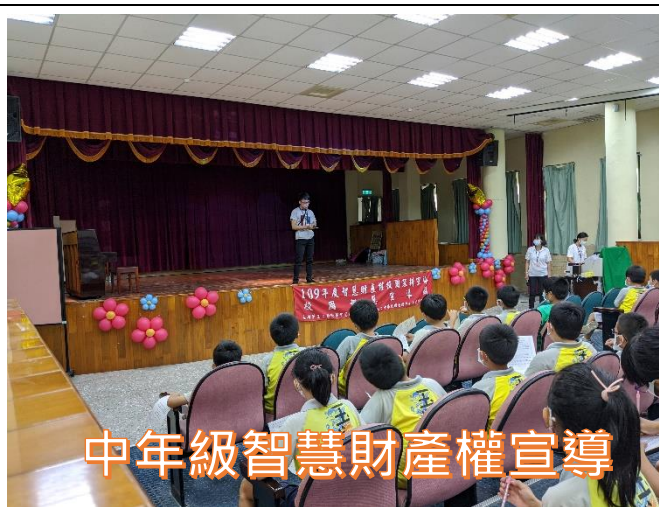
中年級智慧財產權宣導