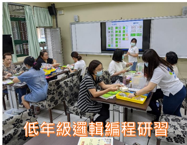
低年級邏輯編程研習