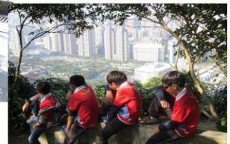
照片也可增添情感效果