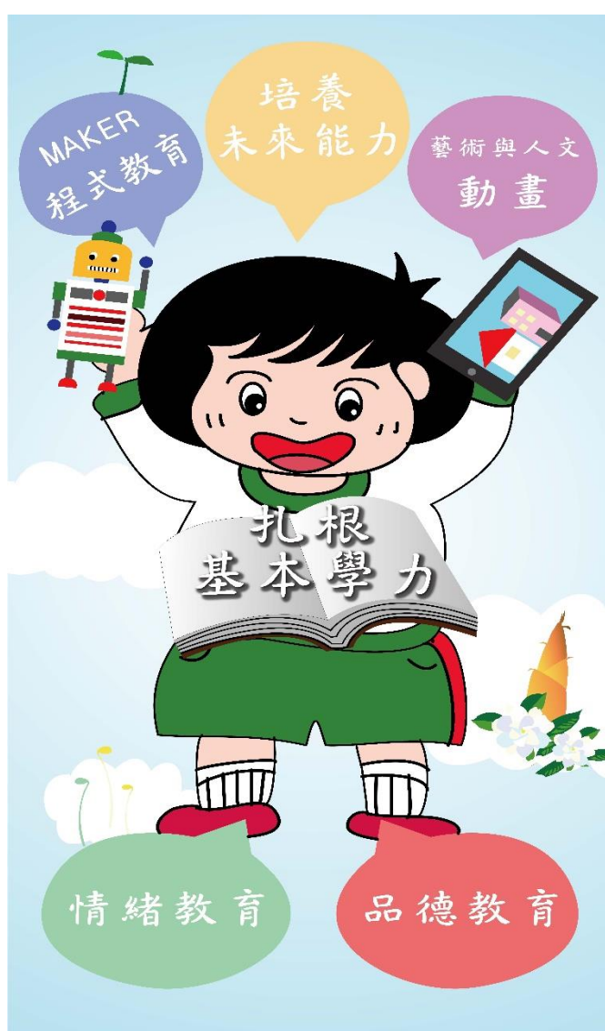
圖二-3 萬大好兒童圖象

方向以萬大兒童呈現，將學校的立足點、經營的主體、拚搏未來的工具、念茲在茲的想法分別以人的腳、身體、手與頭部來顯示，讓全體家長、教師、學生對於學校未來的發展方向一目了然。結合新課綱素養導向的學習、結合未來社會的所需、以及本校競爭力的所在，我們的教育方向是培養能適應現在和未來的終身學習者、立足品德教育的深耕與情緒教育的薰陶、扎根基本學力與能力、並培養與外界競爭的能力如：創客精神的程式教育和美感素養的動畫課程。至今歷經三年的經營，在教師、家長、學校的引導、啟發及關懷下，孩子儘管開始是一顆貌不驚人的種子，目前漸已形成一整個花季的燦爛！