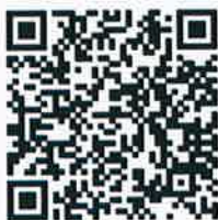
行動學習智慧教學量化指標檢核表 google 表單

需每週填報量化指標檢核表(google 表單)，並於申請年度繳交相關成果或參加相關競賽(詳如下表)，鼓勵申請的教師們結合公開觀授課之辦理及教案撰寫，並可於每個月的行動學習智慧教學社群時間進行共備觀議課，進行教學分享及精進。