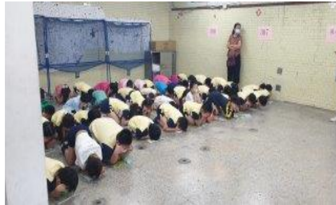
自強樓地下室避難