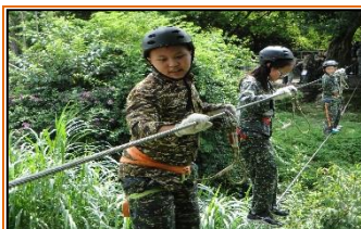
暑期人權法治教育體驗營