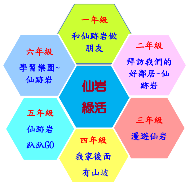
景興國小校本特色課程「仙岩綠活」架構圖