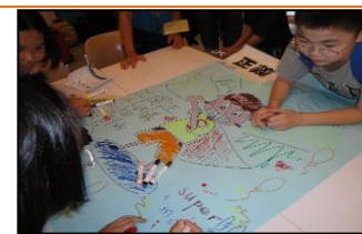
小組討論思辨正義的真諦