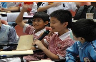
人權法治小學堂活動搶答