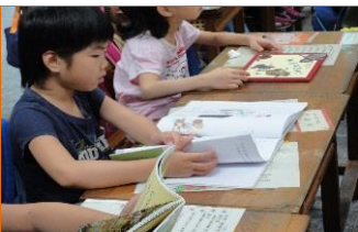
班級品德故事繪本導讀