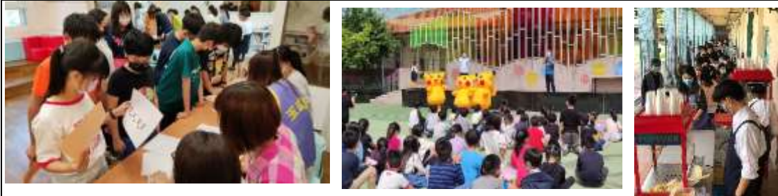
111 年兒童節系列活動，英文闖關、童玩體驗、多元文化，好吃好玩又學習都在這一天。