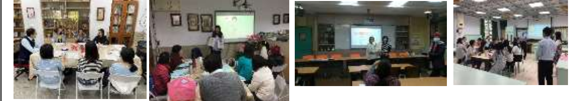
成立英語專業社群，並透過校內及跨校共備研討雙語課程設計及英語教學