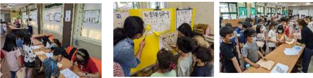
110 年兒童節英語闖關，由銘傳大學國際學院外籍生協助擔任關主導引學生聽說讀