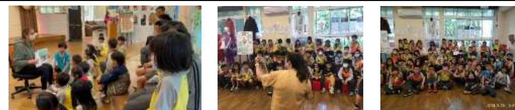
每月末外師在圖書館說故事，內容多元生動有趣，是孩子們下課之餘喜愛的活動