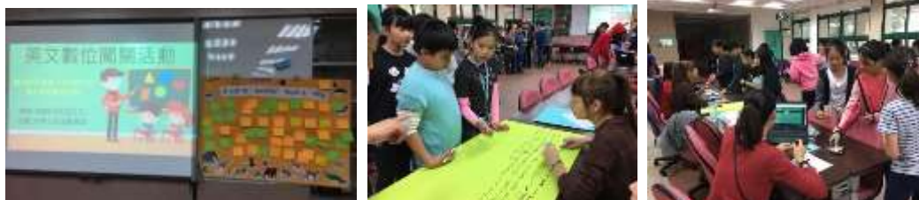
英文數位闖關活動，動腦pk的英文單字接龍，完成闖關後學生自行刷卡過關