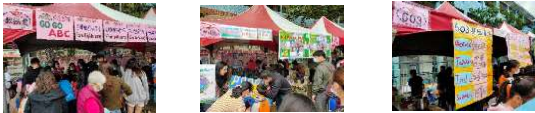
園遊會 go go shopping 活動，學生到各攤位買東西須使用英語通關密語購物