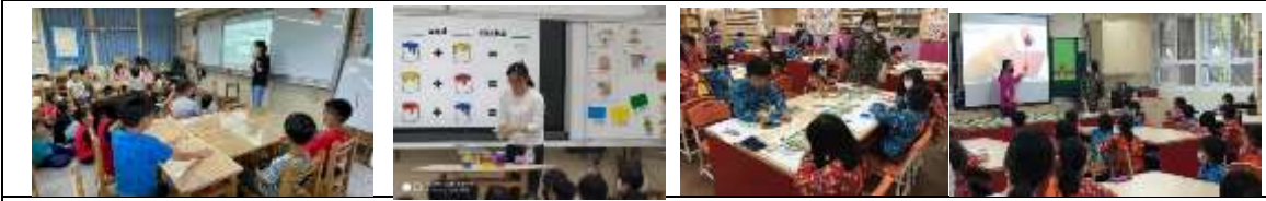
英語融入領域教學，做為雙語課程教學的前導，讓學生有更多學習英語的機會