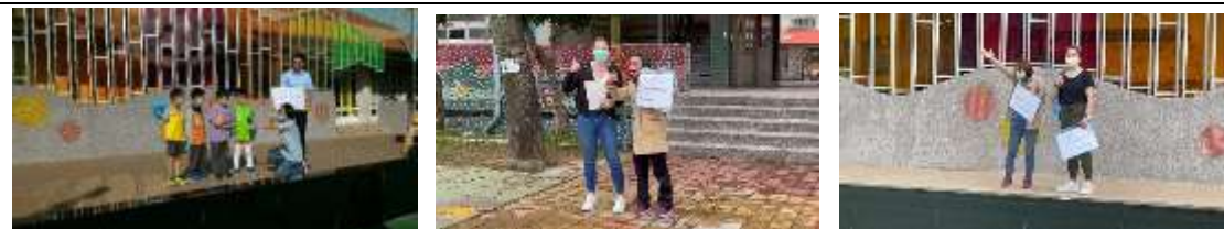
每周一句由雙語老師與外師協同教學，分低中高年段隨機抽學生上臺口說練習