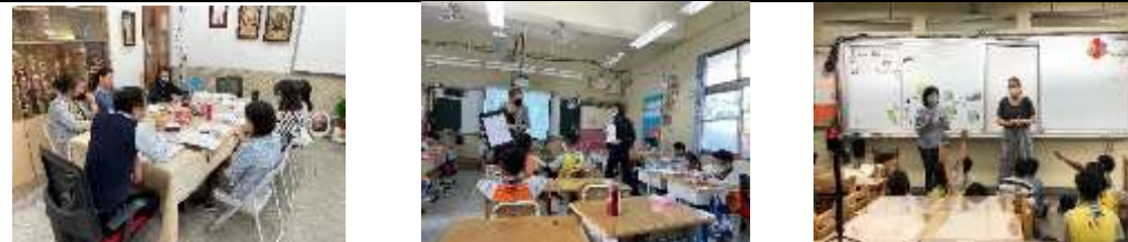
學校安排外師與老師的協同教學，讓全校各班學生都能體驗雙語學習的課程