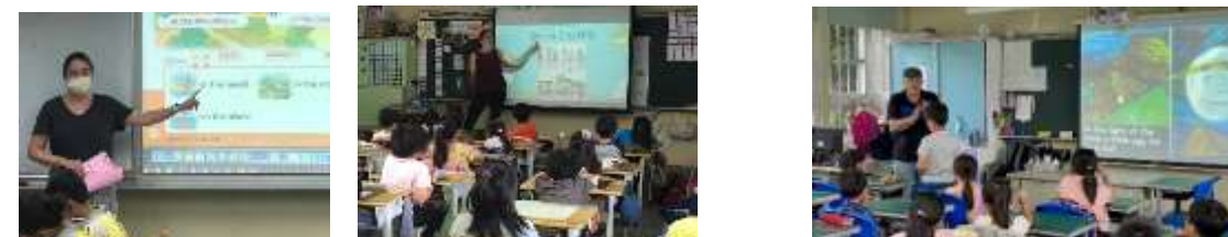
雙語外師入班協同教學及巡迴外師到校教學，提供孩子們與外師溝通交談的機會