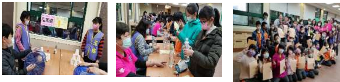
「雙語科學日」活動，讓學生透過闖關體驗自然科學動手做的樂趣。