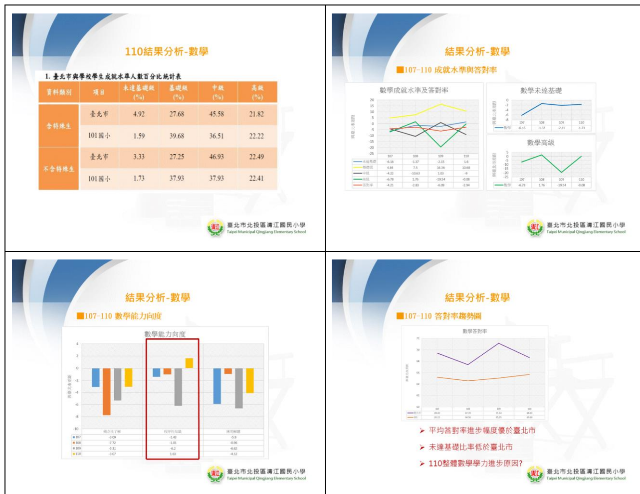
表 1-6 數學科學生基本學力檢測結果分析一覽表