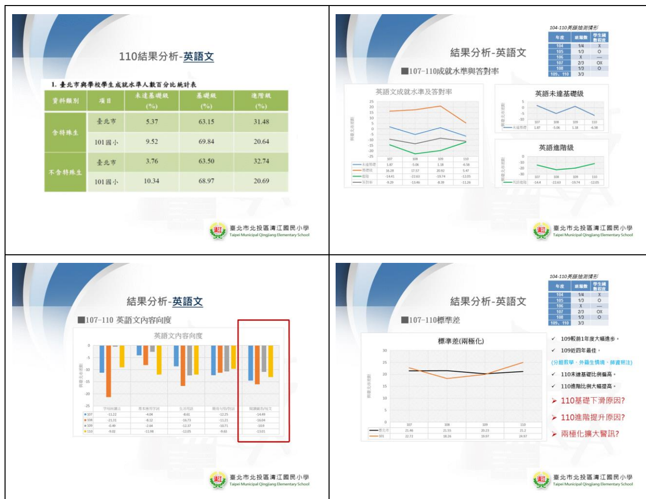
表 1-7 英語科學生基本學力檢測結果分析一覽表