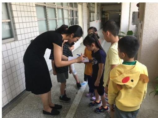
家長志工協助學生完成英語歌曲