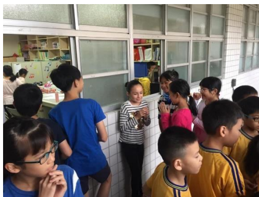
學生參加英語日活動情形