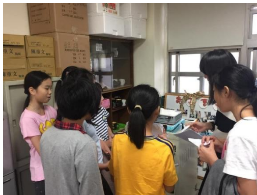
英語日歌曲驗收情形