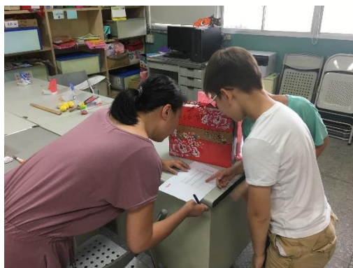
學生參加英語日活動情形