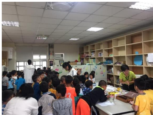
英語日歌曲驗收情形