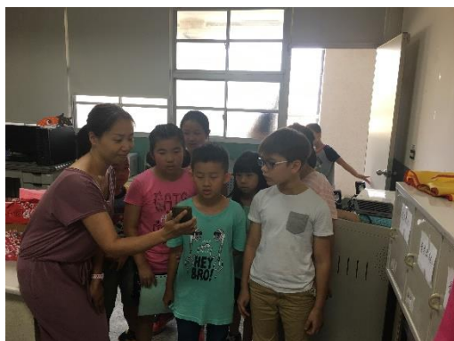
學生參加英語日活動情形