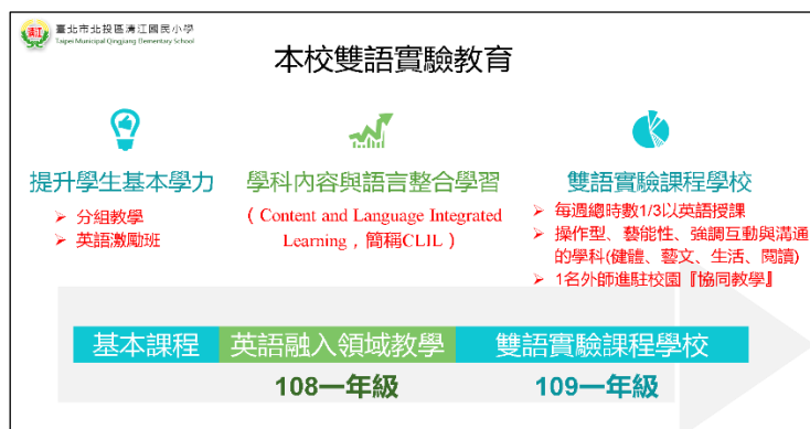
圖 1 清江國小雙語實驗課程實施層面圖

清江國小的雙語教學採「語言與學科內容統整教學」的模式，簡稱 CLIL(Content and Language Integrated Learning)，它是一種透過一個額外的語言(外國語或第二語言)來學習內容的教學方法，強調雙重知能發展，同時發展學科與英語知能。期利用 CLIL 教學模式，提供學生練習語言的機會，並從中習得應當學到的學科知能(學用合一)，並利用貼近學生生活經驗的教學內容，增進學生學習的自信心及學習動機，提供學生語言學習的機會。本校雙語實驗課程實施層次如下：