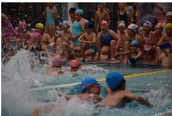
圖 E-1 寓教於樂的水上運動會