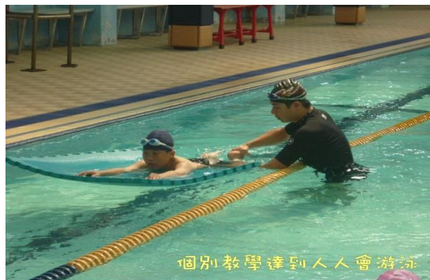
圖 E-2 個別教學達到人人會游泳