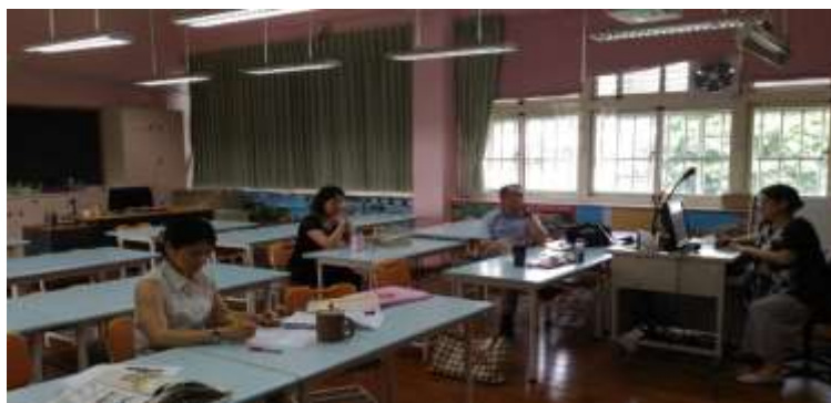
期末課程活動與教學分享