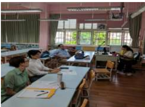
學力檢測結果分析與教學分享