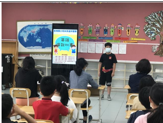
校內多語文競賽英語演說