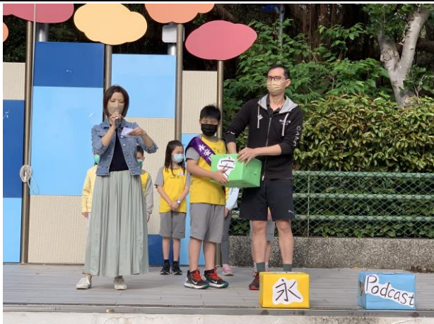
永安 Podcast 抽獎活動