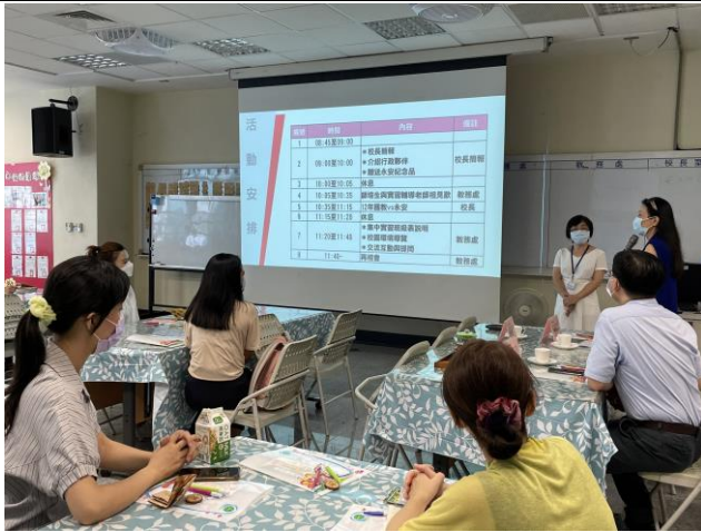
國北教大雙語實習生來訪