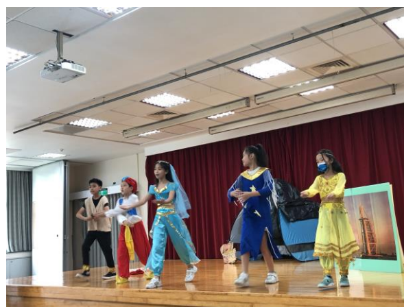
校內多語文競賽英語戲劇表演