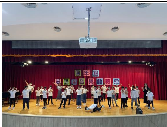
四年級英語暨音樂發表會成果