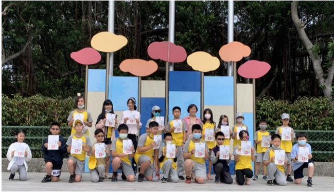
校內多語文競賽兒童朝會頒獎