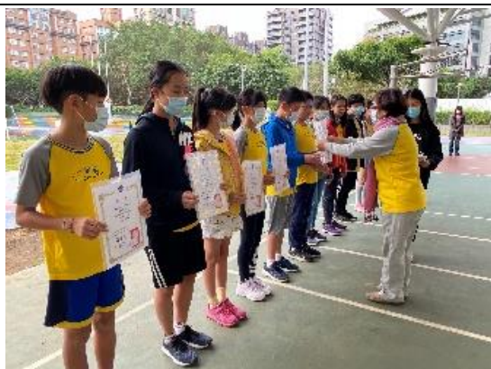
學生參加 Cool English 英語線上學習平臺活動表現優異