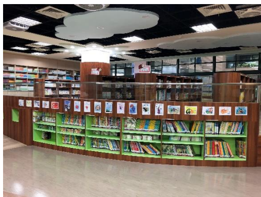
主題書展英語數位閱讀區