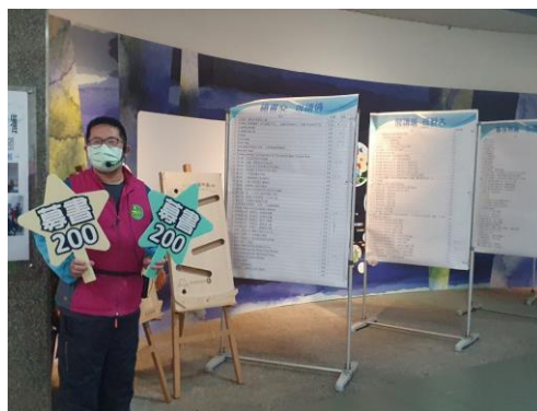
募書 200 活動