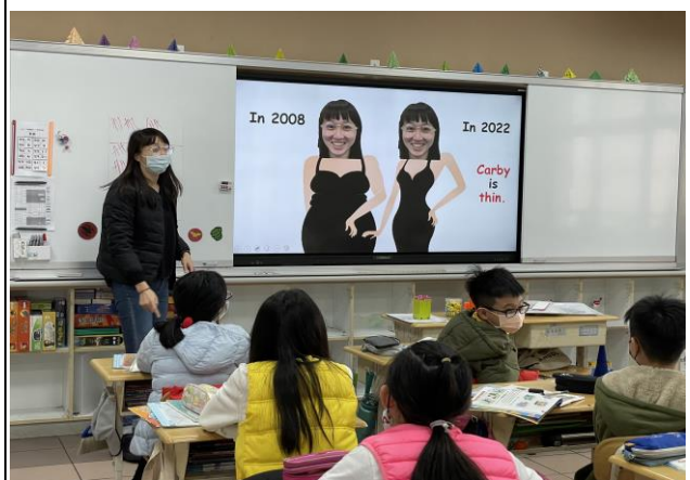
校內英語老師公開授課。