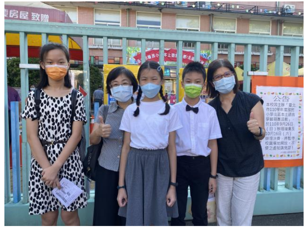
臺北市多語文競賽英語演說