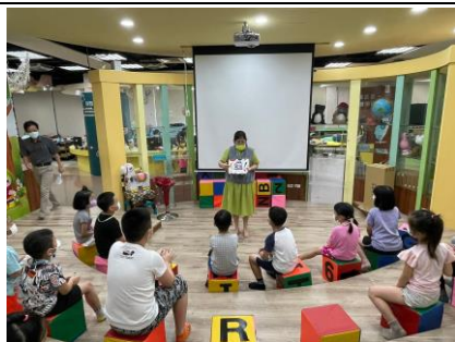
圖書館童話娃娃屋進行英語繪本教學