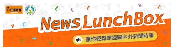
每日中午全校收聽英語廣播新聞節目 ICRT。