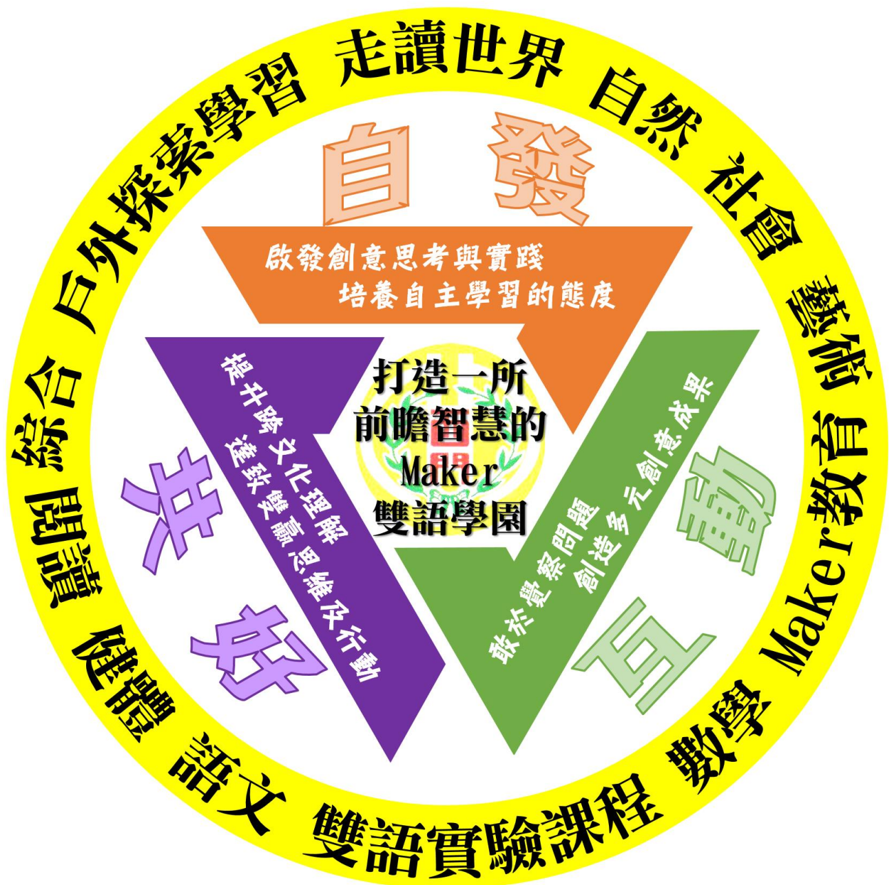
臺北市萬華區西門國民小學學校願景與課程願景圖像