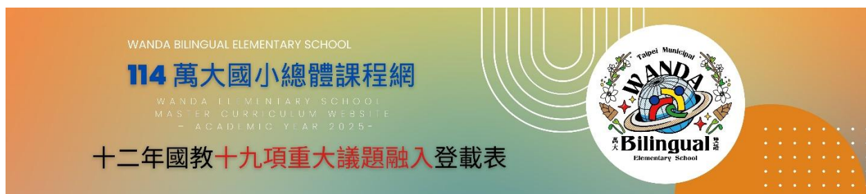
附表 10-法律規定及重要教育議題實施規劃統計分析表

本校在課程撰寫的同時採本統計分析表單來統計，旨在系統性蒐集與整理本校教師於議題課程的安排中，重視現行法律規定之性平教育法、特殊教育法、校園霸凌防制準則等強調之重要教育重點議題課程，提升整體教學品質和學生鏈結生活知識的能力與素養。表單統計結果顯示，多數教師能基本落實相關法規要求，但在「教材融入深度」及「課堂討論策略」方面仍可有深入發展的空間，未來將依據調查結果，強化相關主題研習、建立校本資源平台，並深化行政支持系統，以協助教師更有效地將法律規定與重要教育議題融入日常教學與校園文化之中。