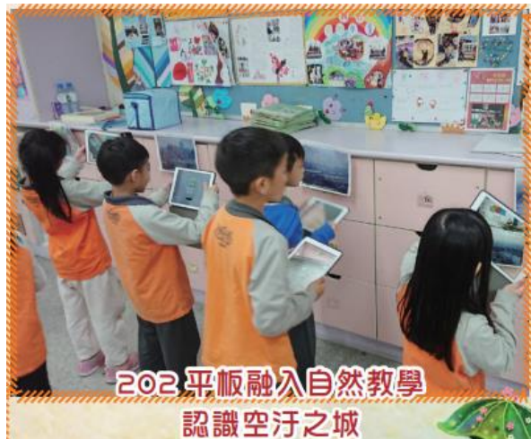
202 平板融入自然教學 認識空汙之城