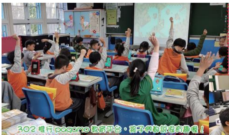
302 推行 pagamo 教育平台，孩子們都說很有趣喔！