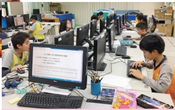
國際小學生電腦創意寫作競賽