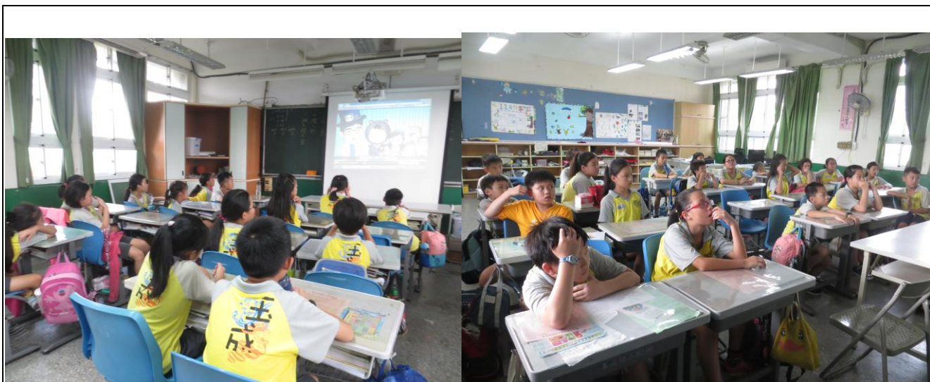
授 課 照 片