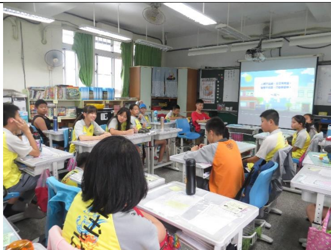
授課照片 (601 班) 學生觀看「資訊素養與倫理」動畫影片