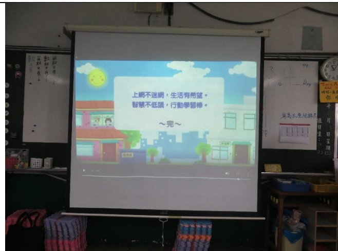
學生發表觀看後的感想