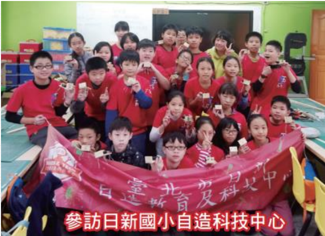
參訪日新國小自造科技中心