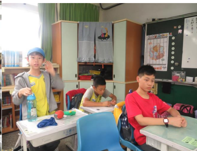
授課照片 (602 班)