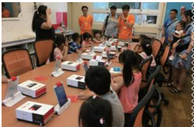
新生體驗 - 電子載具平板大挑戰