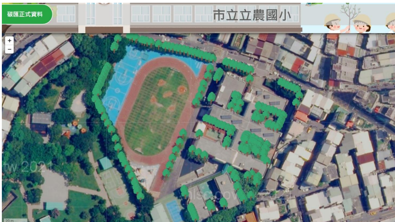
圖二：校園樹木觀察記錄平台