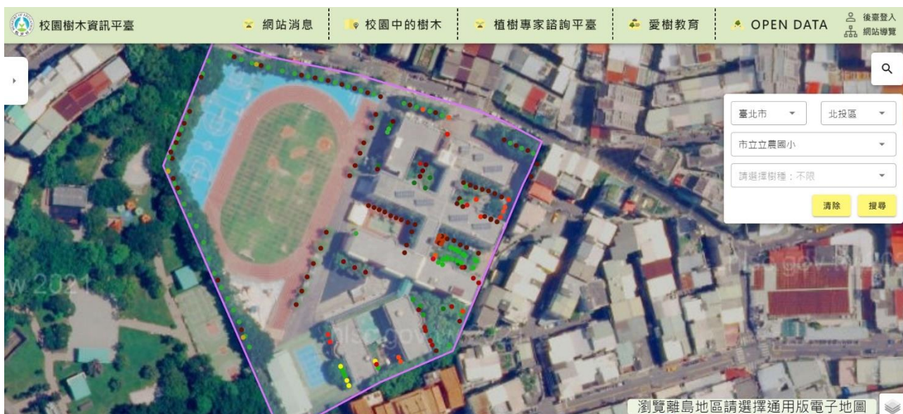
圖一：校園樹木資訊平臺

(二)根據以上的項目結合教育部建置的「校園樹木資訊平臺」及「校園樹木觀察記錄平台」，整合校園樹木地圖系統，提供學校查詢及瀏覽校園環境樹木資訊，建置常見樹木圖鑑資料庫，以及相關養護管理知識內容，提供多元學習資源，增進學校師生落實愛樹行動。長期而言，可達到綠化、固碳、降溫與提供生物棲所等功能。