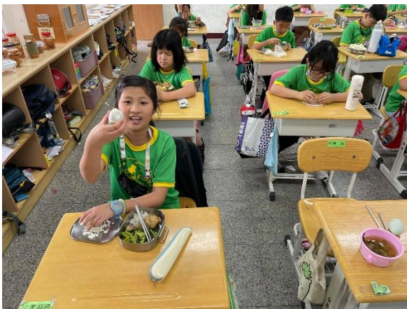
四年級/ 品嚐自己做的鹹鴨蛋