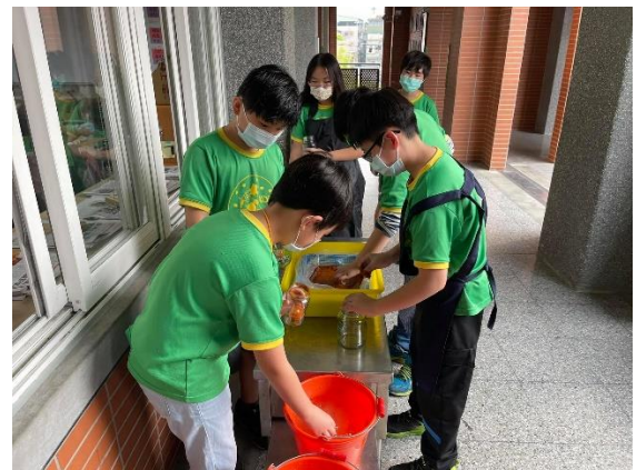
四年級/ 將鴨蛋塗抹鹽紅土後裝罐