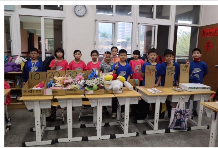
三年級/整理二手物品與瓦楞紙標價牌