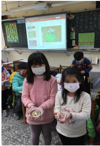
二年級/邀請同學分享米糰雕的成果與感恩理念。