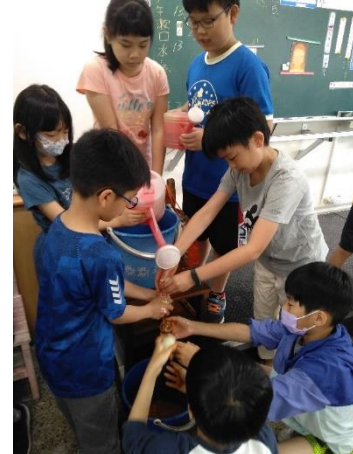
四年級/ 仔細清洗鴨蛋