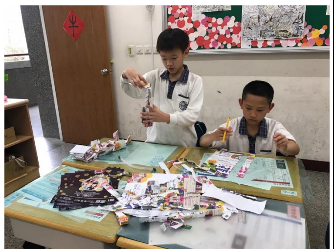
三年級/嘗試紙質的再利用