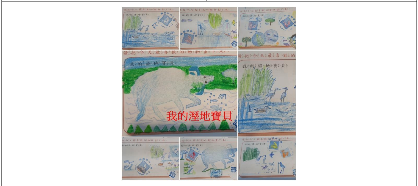
一年級/ 照片說明：我的濕地寶貝