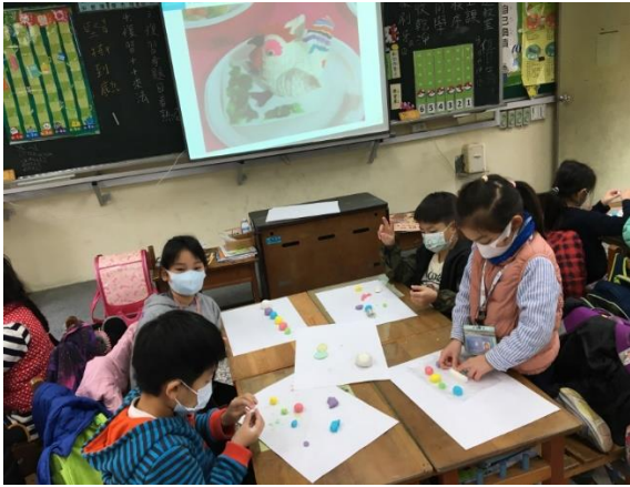
二年級/結合簡報資源，讓同學了解米糰雕的歷史與製作過程。