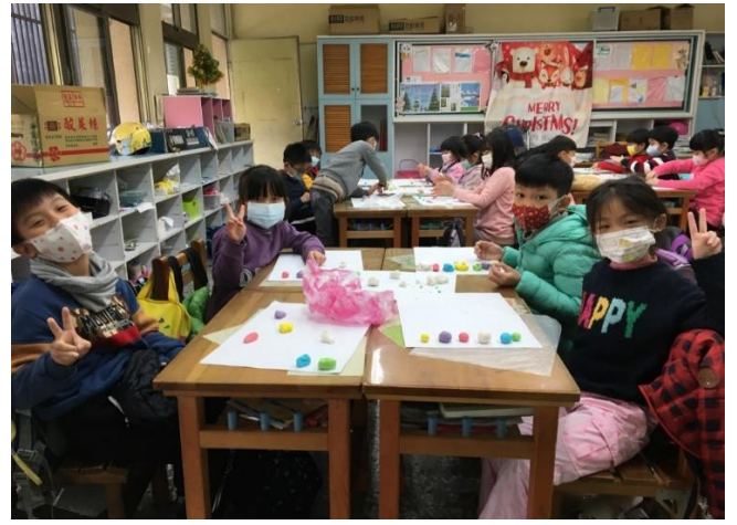
二年級/藉由米糰雕課程，引導同學生活美勞課應用混色的概念，並發揮創造力，做出屬於自己的作品。