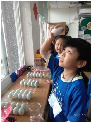
四年級/ 辨別鴨蛋是否新鮮