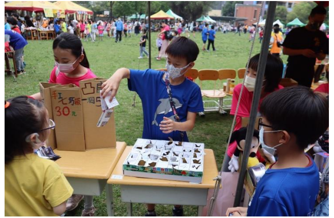
三年級/園遊會現場解說