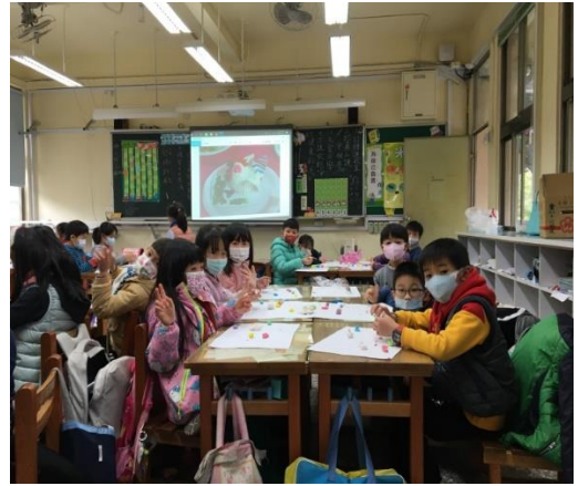
二年級/藉由小組活動進行，鼓勵同學分享與觀摩。