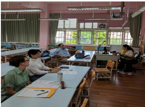
學力檢測結果分析與教學分享