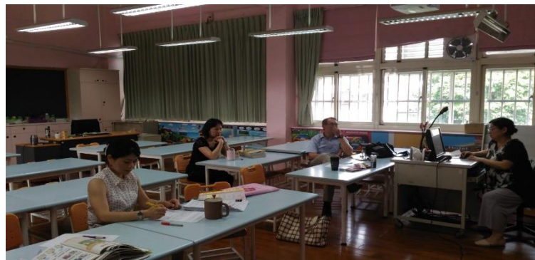
期末課程活動與教學分享