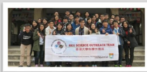
圖2 與香港大學進行科學指導交流活動